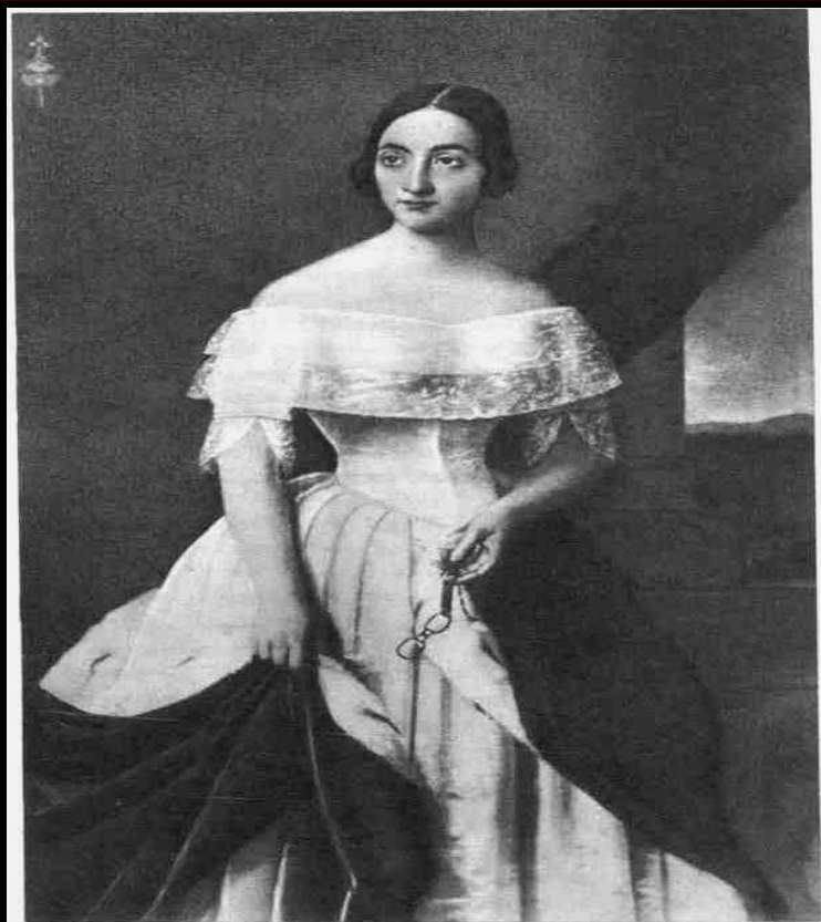
Екатерина Николаевна Гончарова.