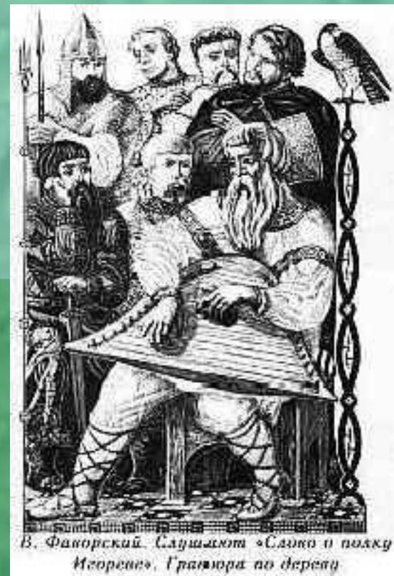
В. Фаворский. Сцены из «Слова о полку Игореве». Гравюра по дереву

■ “Слово о полку Игореве” является историческим памятником древнерусской литературы. Это величайшее произведение своего времени. “Словом о полку Игореве” нам с большой точностью передан образ Древней Руси. В него входят характеры русских людей, описания природы, мирного труда. Главным чувством, волновавшим автора “Слова о полку Игореве”, была любовь к Родине, к русской земле, к народу. Автор скорбит о разъединении Великой Руси. Он - великий русский мыслитель рисует разные слои народа XII века. Он противопоставляет их смелость, доблесть, и трудолюбие стремлению князей к обособлению. В “Слове о полку Игореве” описаны страдания простого народа от набегов половцев.