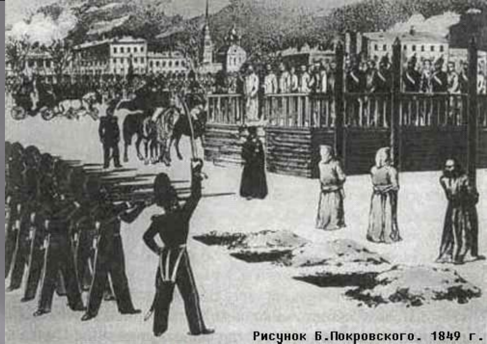
Рисунок Б.Покровского. 1849 г.

Через два дня Достоевского заковали в кандалы и отправили в Омский острог, в котором он содержался до февраля 1854 года.