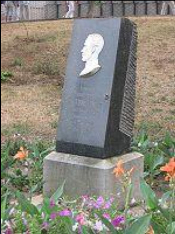
Стела в память участника обороны Севастополя 1854—1855 гг. Л. Н. Толстого у четвёртого бастиона

Когда в конце 1853 г вспыхнула Крымская война Когда в конце 1853 г вспыхнула Крымская война, Толстой перевёлся в Дунайскую армию Когда в конце 1853 г вспыхнула Крымская война, Толстой перевёлся в Дунайскую армию, участвовал в сражениях, был в Севастополе .