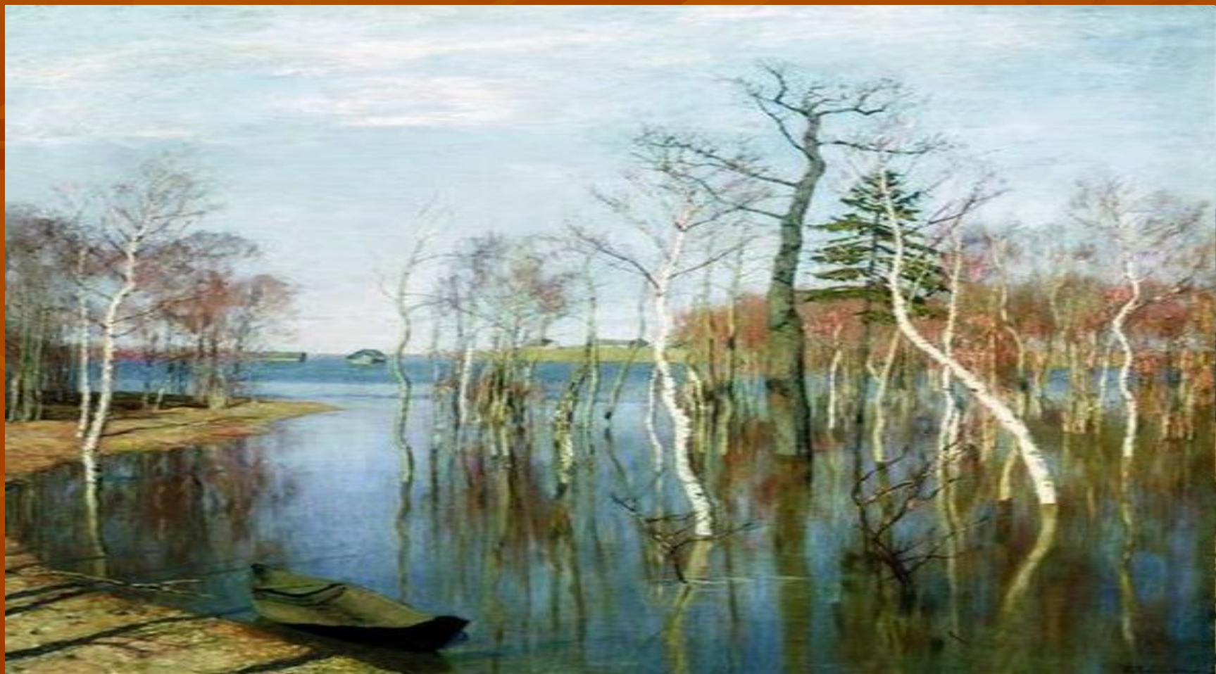
Левитан Исаак Ильич. Весна. Большая вода. 1897г