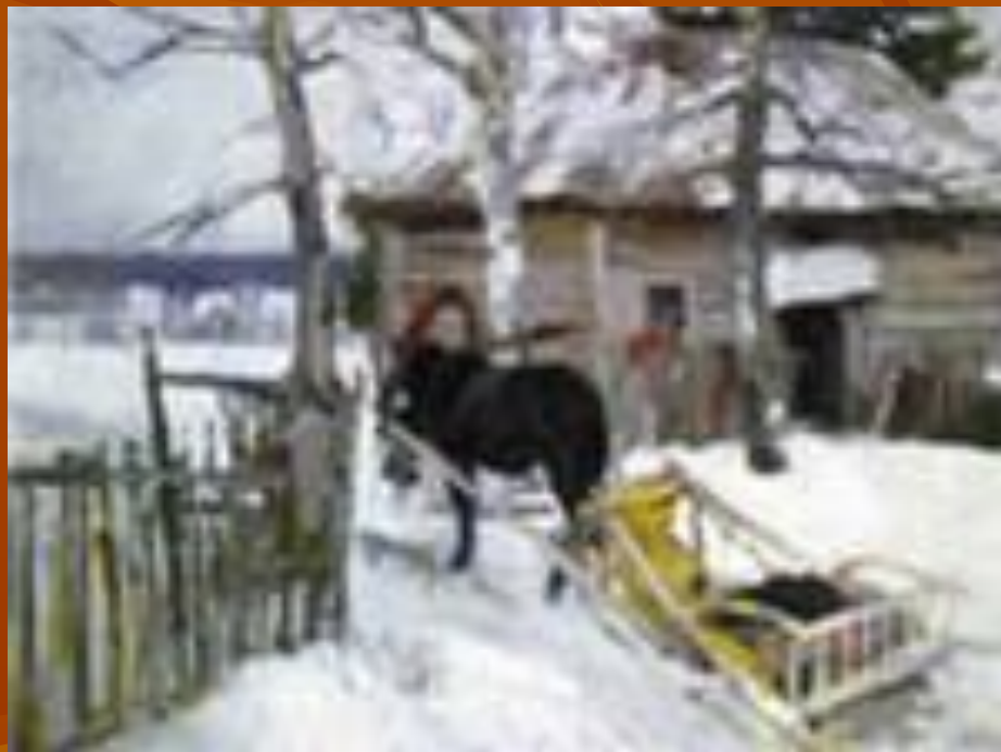
К.А. Коровин . Зимой