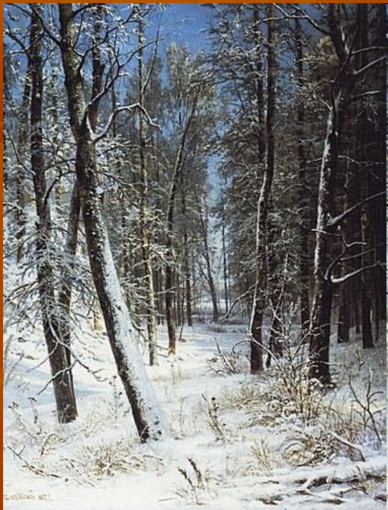
И.И.Шишкин «Зима в лесу»