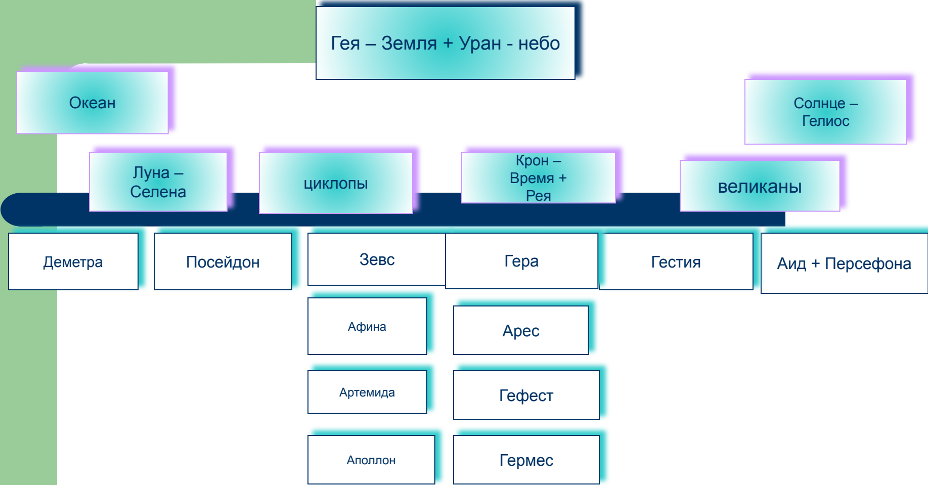
Генеалогическое древо древнегреческих богов