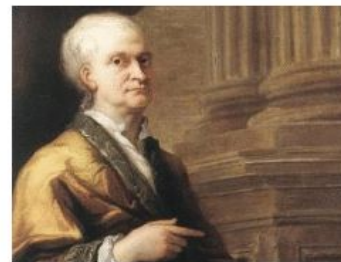
Исаак Ньютон (Isaac Newton) во времена российского ученого М.В. Ломоносова был известен как «Исаак Невтон»

А всемирно известные романы всемирно известного английского писателя сэра Уолтера Скотта (Walter Scott; 1771–1832) «Айзек» (1810) и «Кресты»