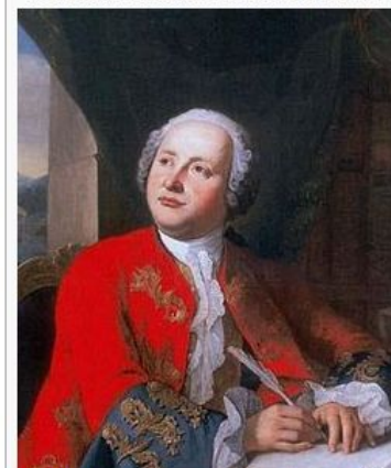
Работа неизвестного художника. Масло [1] .

Дата рождения: 8 (19) ноября 1711 Место рождения: деревня Мишанинская [2] , ныне — село Ломоносово (близ Холмогор), Архангелогородская губерния, Царство Русское Дата смерти: 4 (15) апреля 1765 (53 года) Место смерти: Санкт-Петербург, Российская империя Страна: Российская империя Научная сфера: естествознание, химия, физика, минералогия, история, филология, опто-механика и др. Место работы: Академия наук и художеств (с 1747 — Императорская Академия наук и художеств)