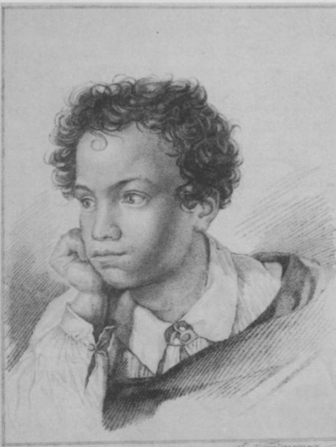
“Пушкин”. Е. И. Гейтман. 1822 г.