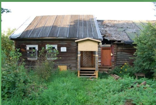
Дом писателя в д. Михеево