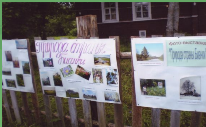
Наши работы на выставке