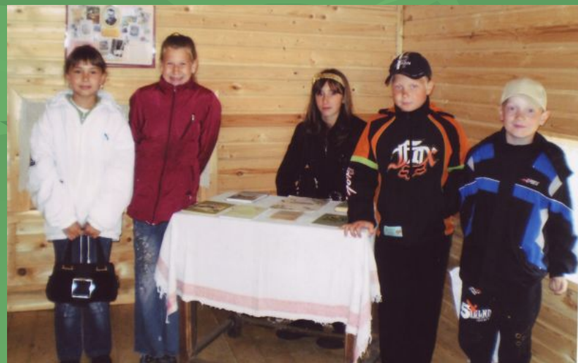
В доме писателя. 2009 г