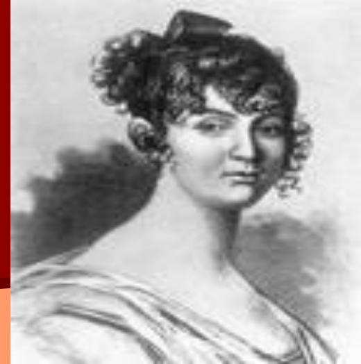
Надежда Осиповна Пушкина