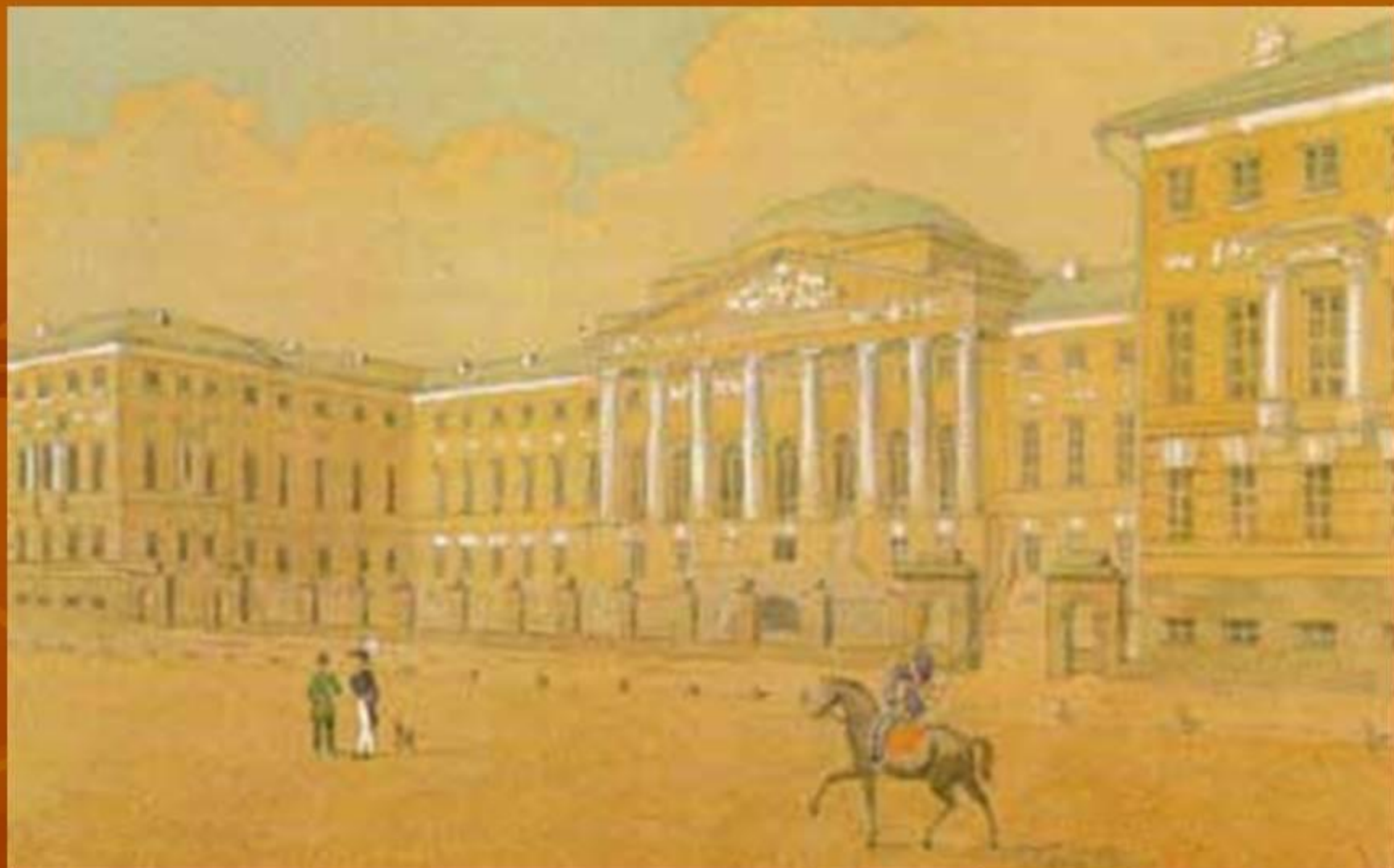
Москва. Благородный пансион при Московском университете.