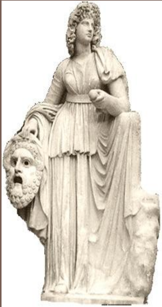
Мельпомена – греческая муза трагедии

возникла из религиозно-культовых обрядов, посвященных богу Дионису ;