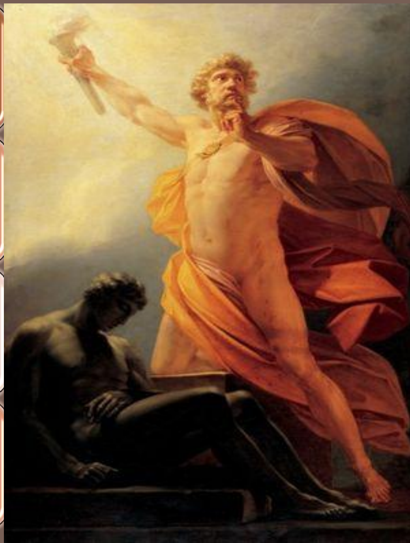
Прометей несёт людям огонь Генрих Фридрих Фюгер, 1817 г.

«все искусства у людей от Прометея»: научил людей строить жилища и добывать металлы, обрабатывать землю и плавать на кораблях, обучил их письму, счёту, наблюдению за звёздами и т. д.