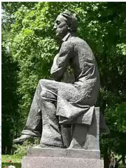
Памятник Тютчеву в музее-заповеднике «Овстуг»