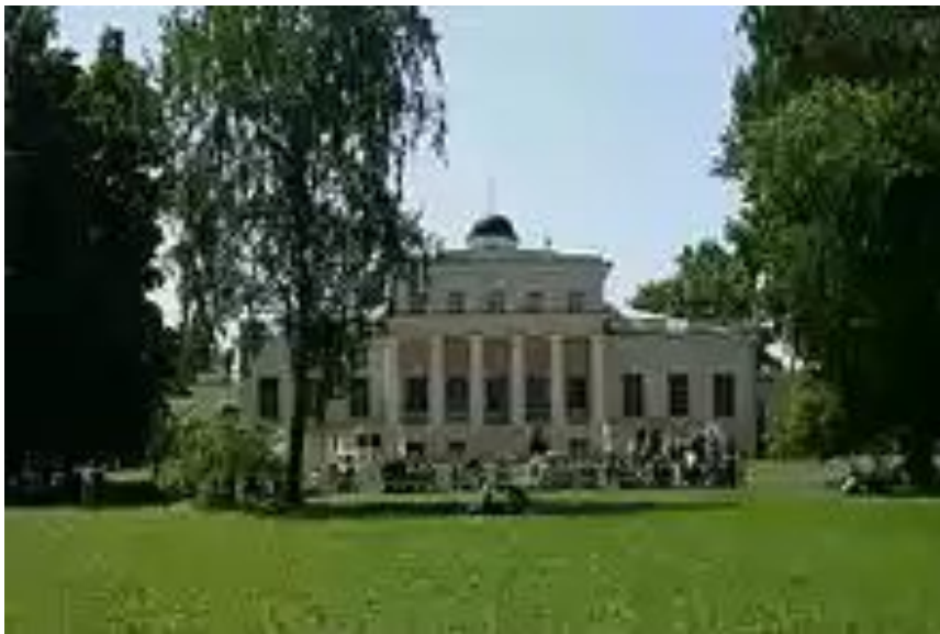
Господский дом в музее-заповеднике «Овстуг»