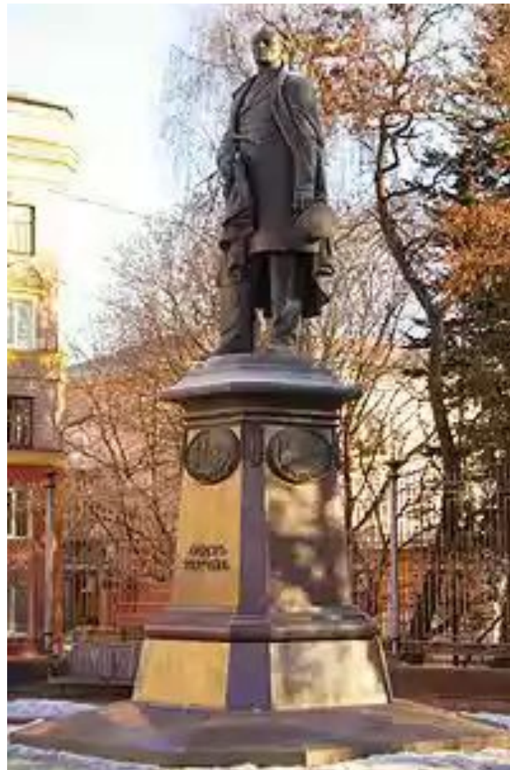
Памятник в Брянске