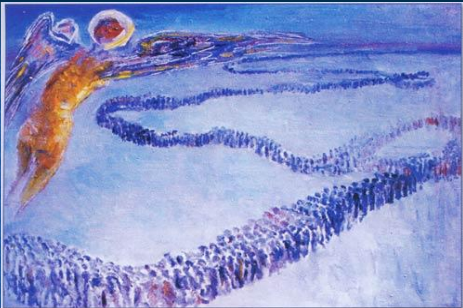
Р.Веденеев. Ангел этапа. 2007