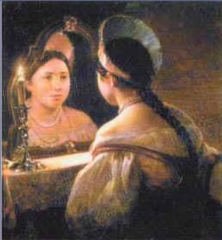
К. П. Брюллов “Гадающая Светлана”

Раз в крещенский вечерок Девушки гадали: За ворота башмачок, Сняв с ноги, бросали; Снег пололи; под окном Слушали; кормили Счетным курицу зерном; Ярый воск топили; В чашу с чистою водой Клали перстень золотой, Серьги изумрудны; Расстилали белый плат И над чашей пели в лад Песенки подблюдны.