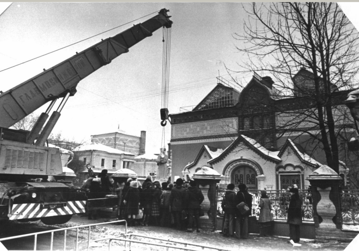
Установка памятника П.М. Третьякова