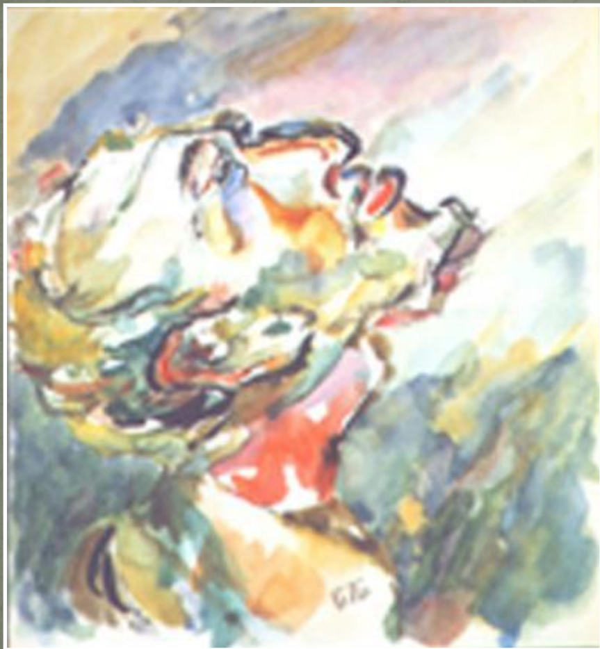
Портрет работы Б. Будницкого