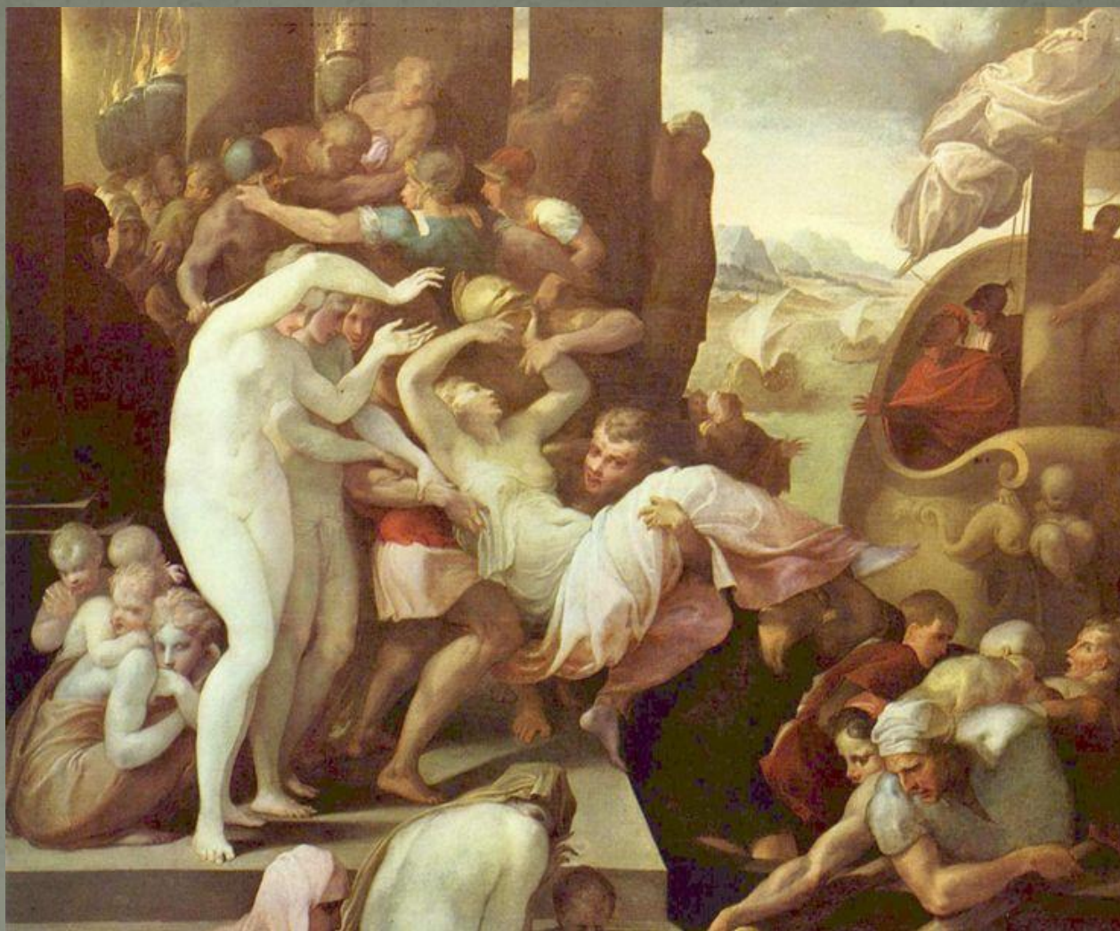
Франческо Приматиччо Похищение Елены, 1530-1539