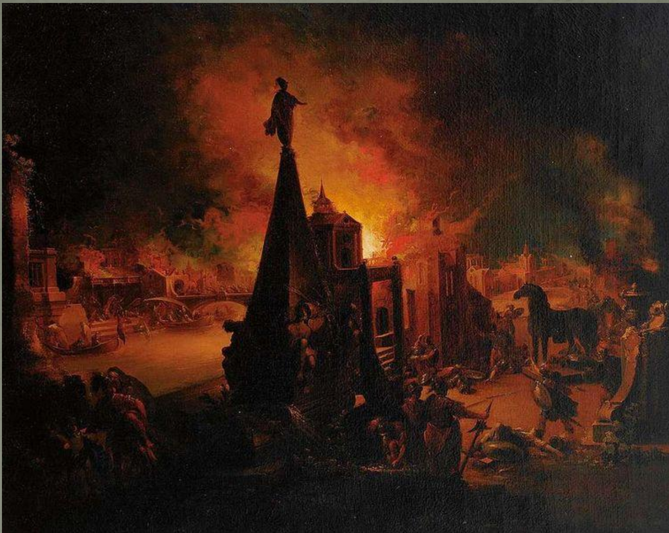
Картина Иоанна Георга Траутманна «Падение Трои»