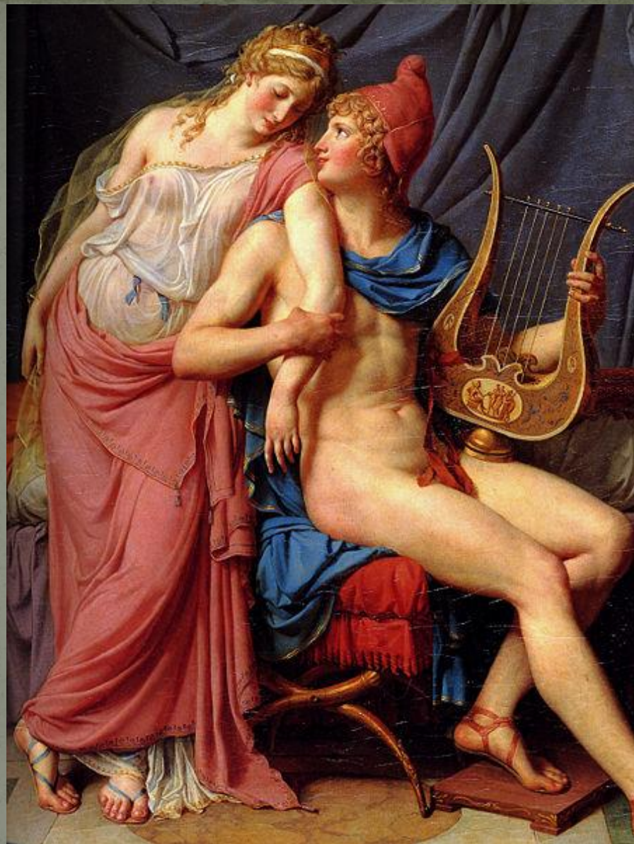
Елена Прекрасная и Парис. Давид, Жак Луи, 1788, Лувр, Париж