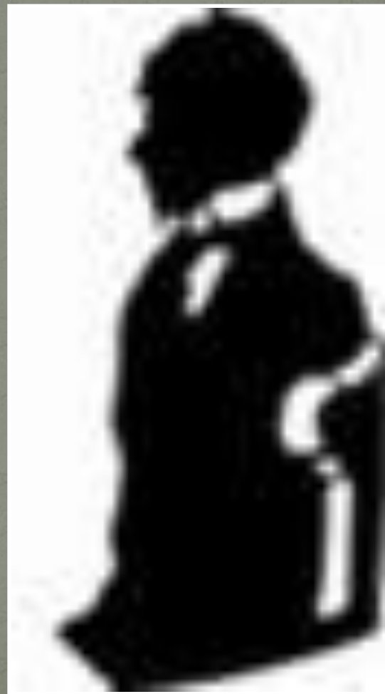
Силуэт работы Е. Кругликовой