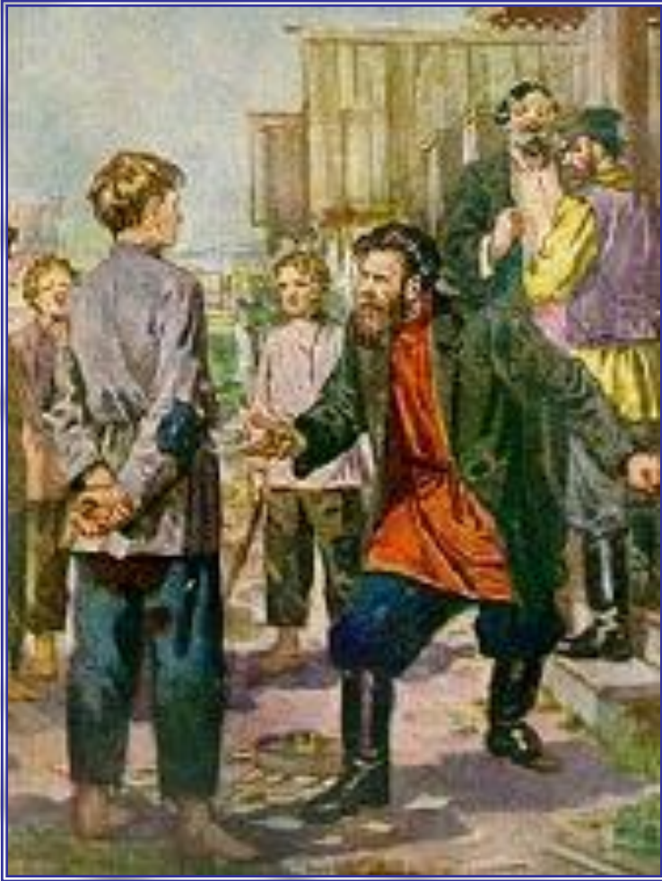
Иллюстрация В. Васильева

«В Косом – то Броду на котором месте школа стоит, пустырь был. Пустополье маленькое, у всех на виду, а не зарились. Нагорье, видишь.