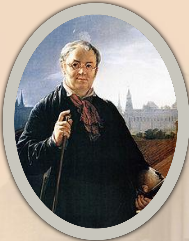
В. Тропинин 1776 -1857