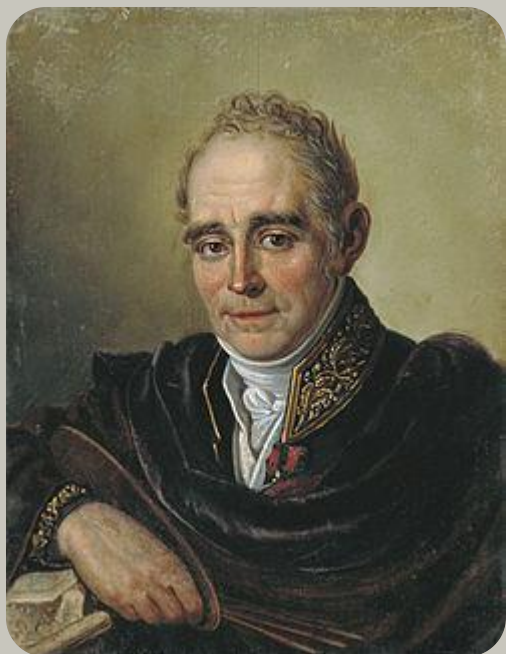
В. Боровиковский 1757 -1825