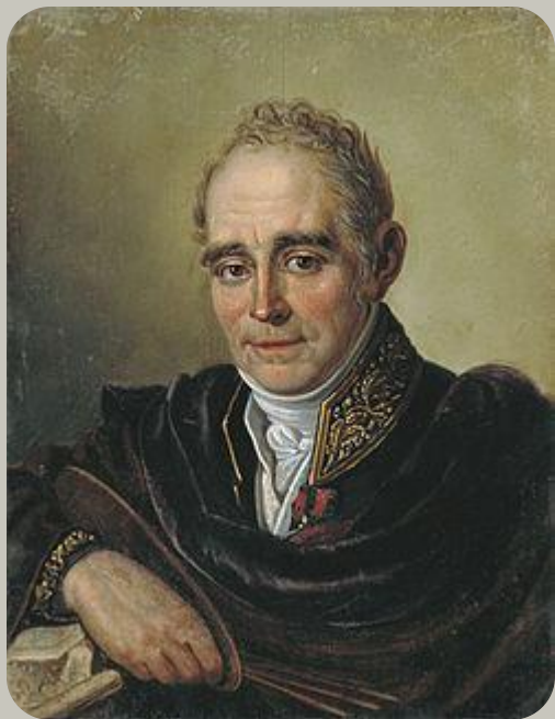
В. Боровиковский 1757 -1825