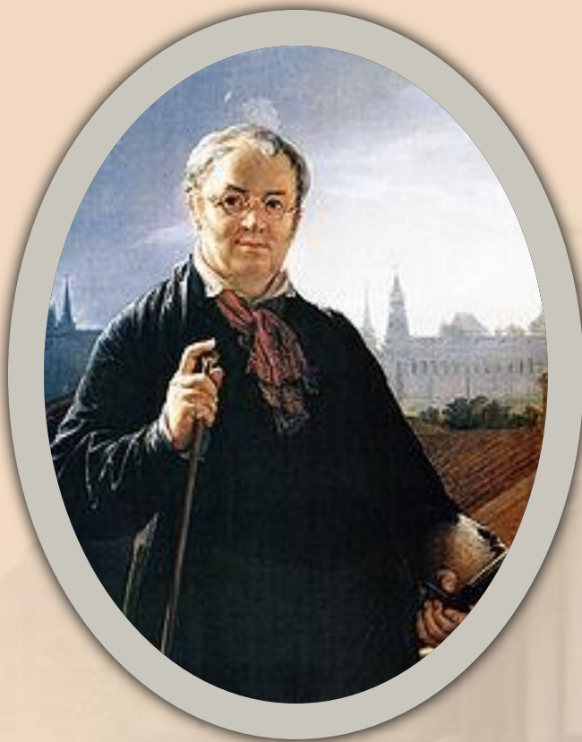
В. Тропинин 1776 -1857