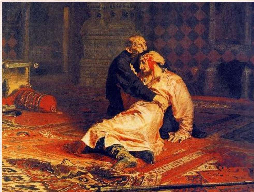
И.Репин. Иван Грозный и сын его Иван...