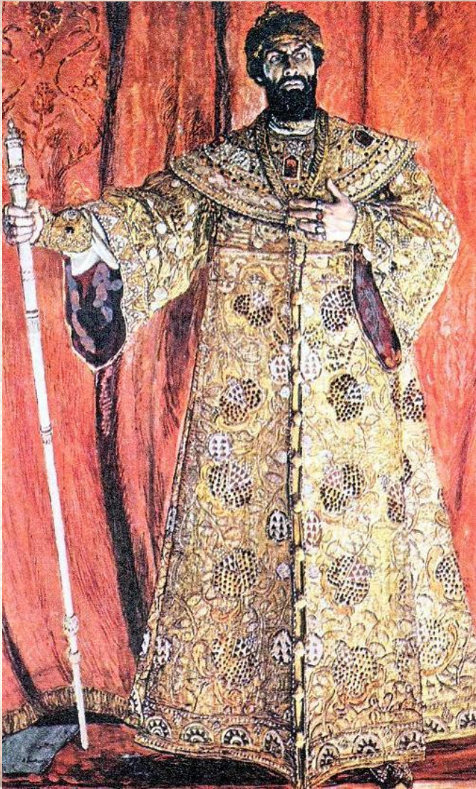
А.Головин. Портрет Ф.И. Шаляпина в роли Бориса Годунова