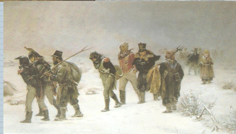
И. М. Прянишников. В 1812