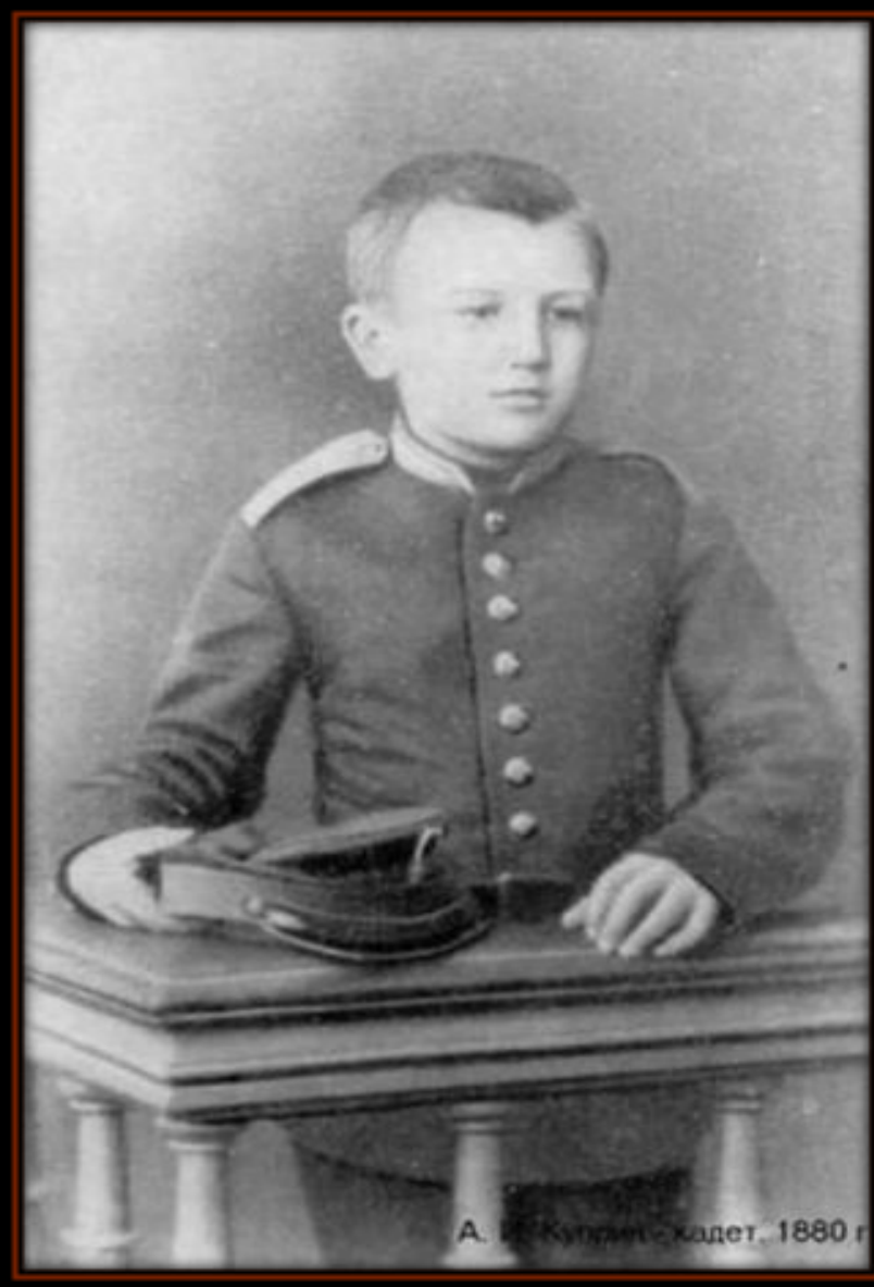
А. И. Куприн - кадет, 1880 г.