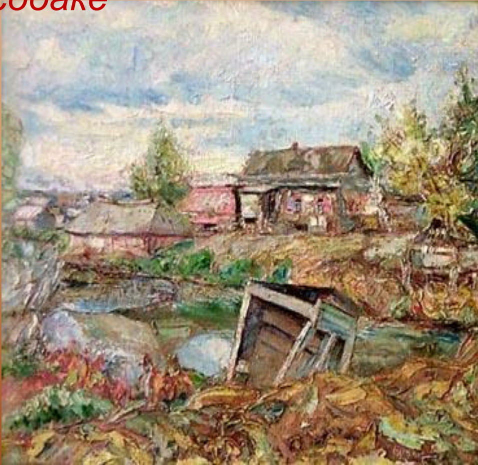
Художник Давид Бурлюк

...она никому не принадлежала у неё не было собственного имени