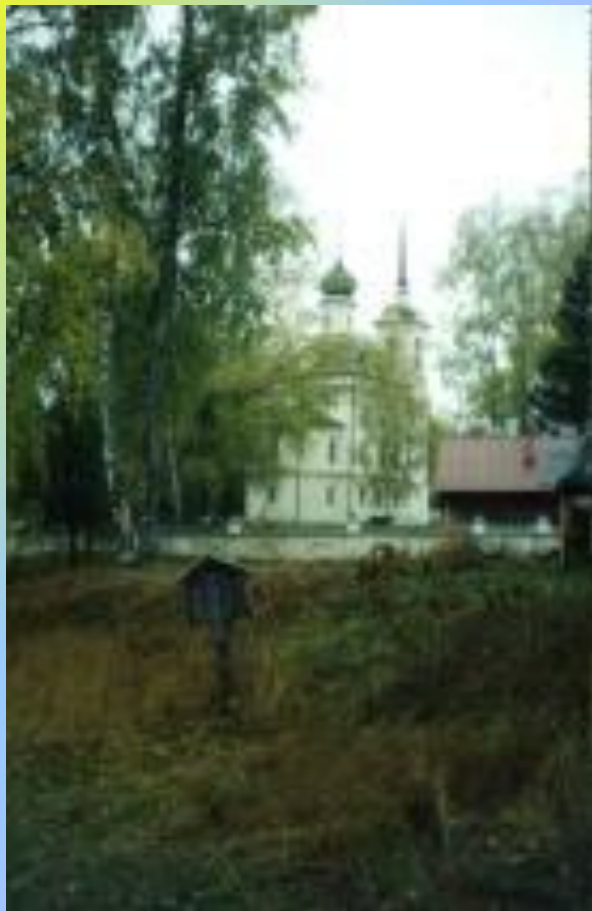
церковь Николы на Бережках.

Эту необычную и замечательную в архитектурном и живописном плане церковь мог построить только очень богатый помещик.