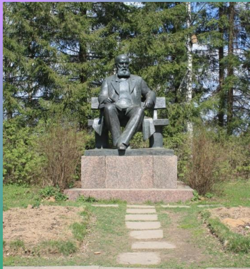
Памятник Островскому в Щельково