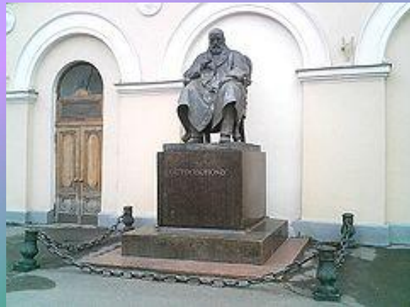
ПАМЯТНИК ОСТРОВСКОМУ У МАЛОГО ТЕАТРА

Детство и юность писателя прошло в Замоскворечье.. Отец женился второй раз на дочери обрусевшего шведского барона, которая не слишком занималась воспитанием детей от первого брака своего мужа. Островский был предоставлен самому себе, ещё в детстве пристрастился к чтению.