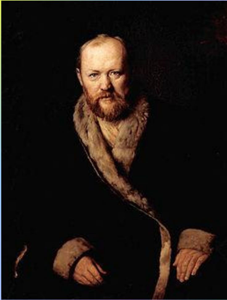
АЛЕКСАНДР НИКОЛАЕВИЧ ОСТРОВСКИЙ

Островский — «бесспорно первый драматический писатель»