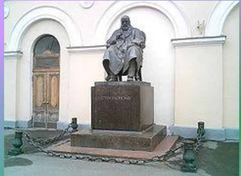
ПАМЯТНИК ОСТРОВСКОМУ У МАЛОГО ТЕАТРА

Детство и юность писателя прошло в Замоскворечье.. Отец женился второй раз на дочери обрусевшего шведского барона, которая не слишком занималась воспитанием детей от первого брака своего мужа. Островский был предоставлен самому себе, ещё в детстве пристрастился к чтению.