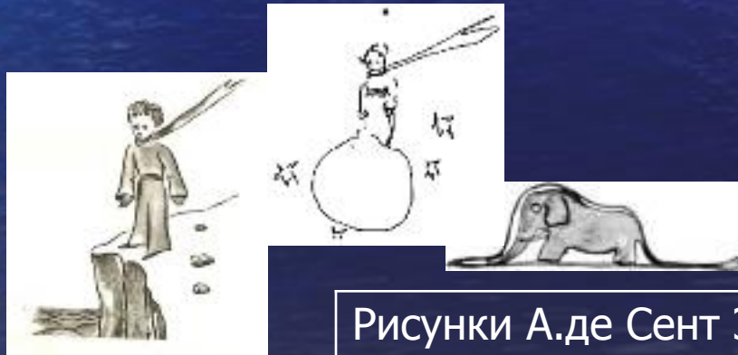
Рисунки А.де Сент Экзюпери

В своём проекте, я бы хотела рассказать о книге А.де Сент-Экзюпери «Маленький принц», показать интересные иллюстрации к ней, сделанные самим писателем и немного рассказать вам о его жизни.