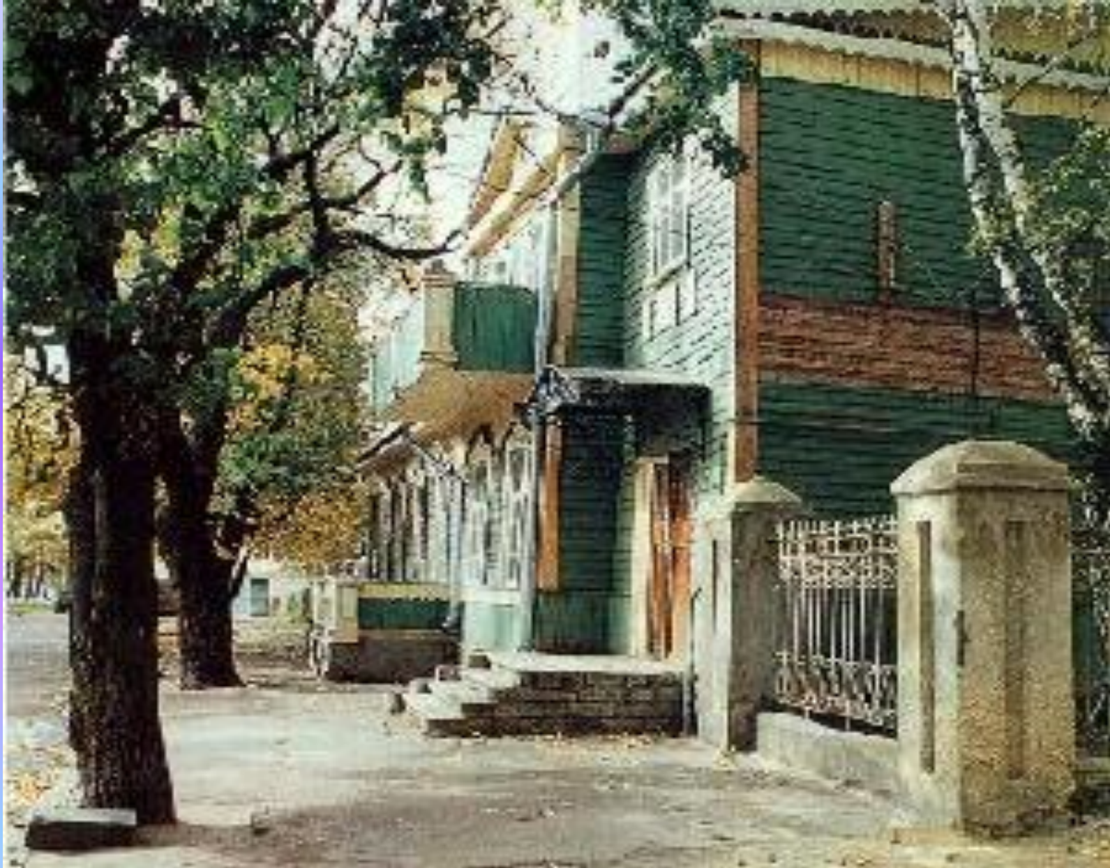
Дом-музей Н.С. Доскова