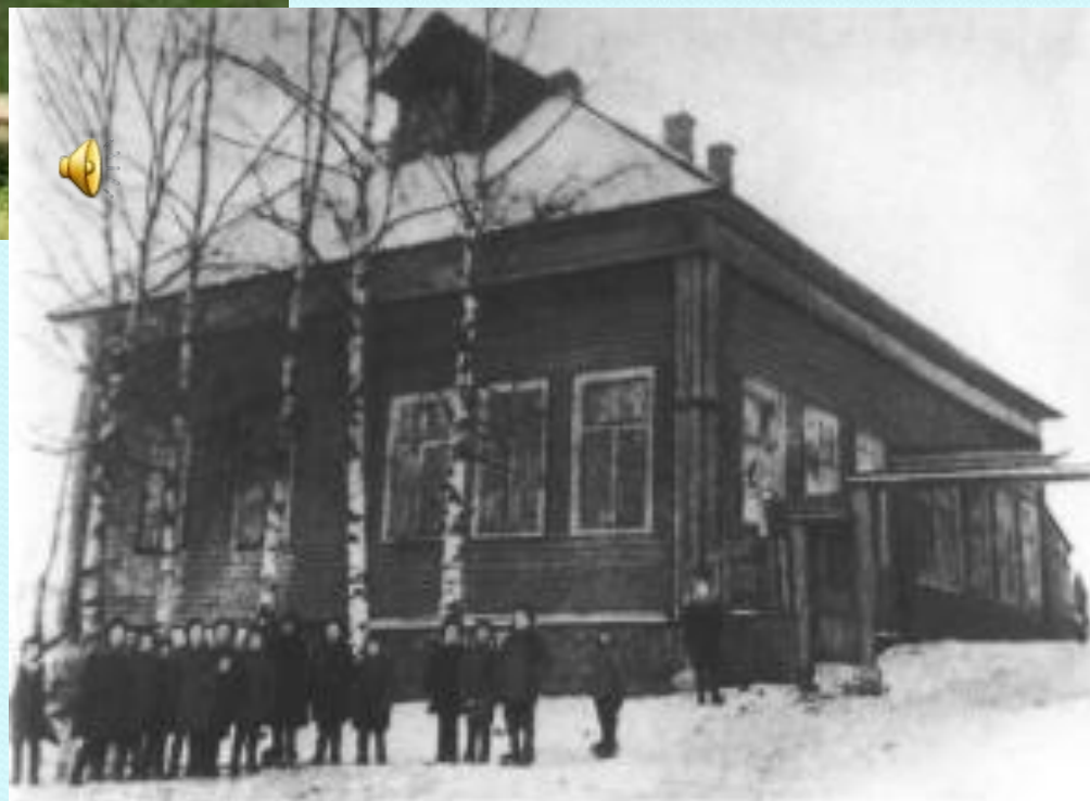
Детский дом в с.Никольское, где в 1943-1950 гг. жил Н. Рубцов