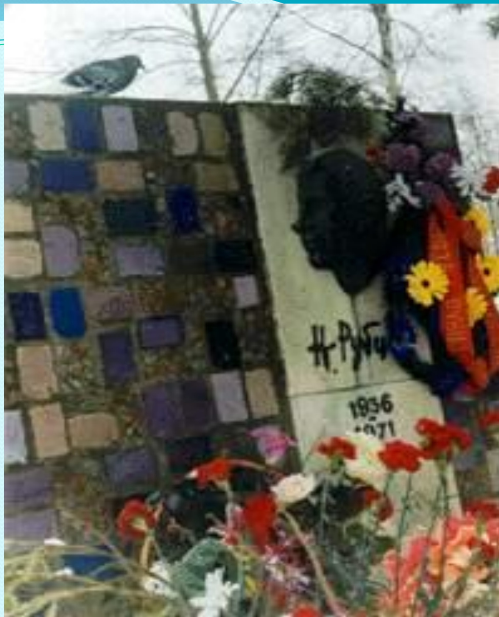
Могила Н. Рубцова