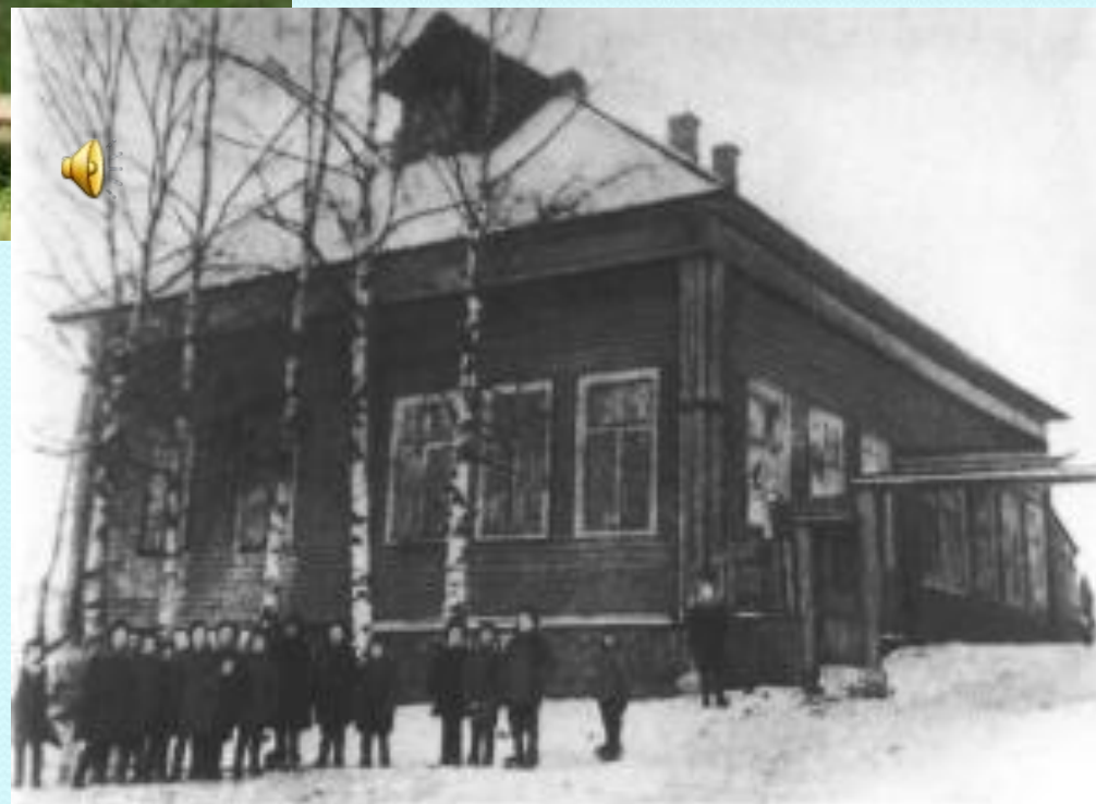
Детский дом в с.Никольское, где в 1943-1950 гг. жил Н. Рубцов