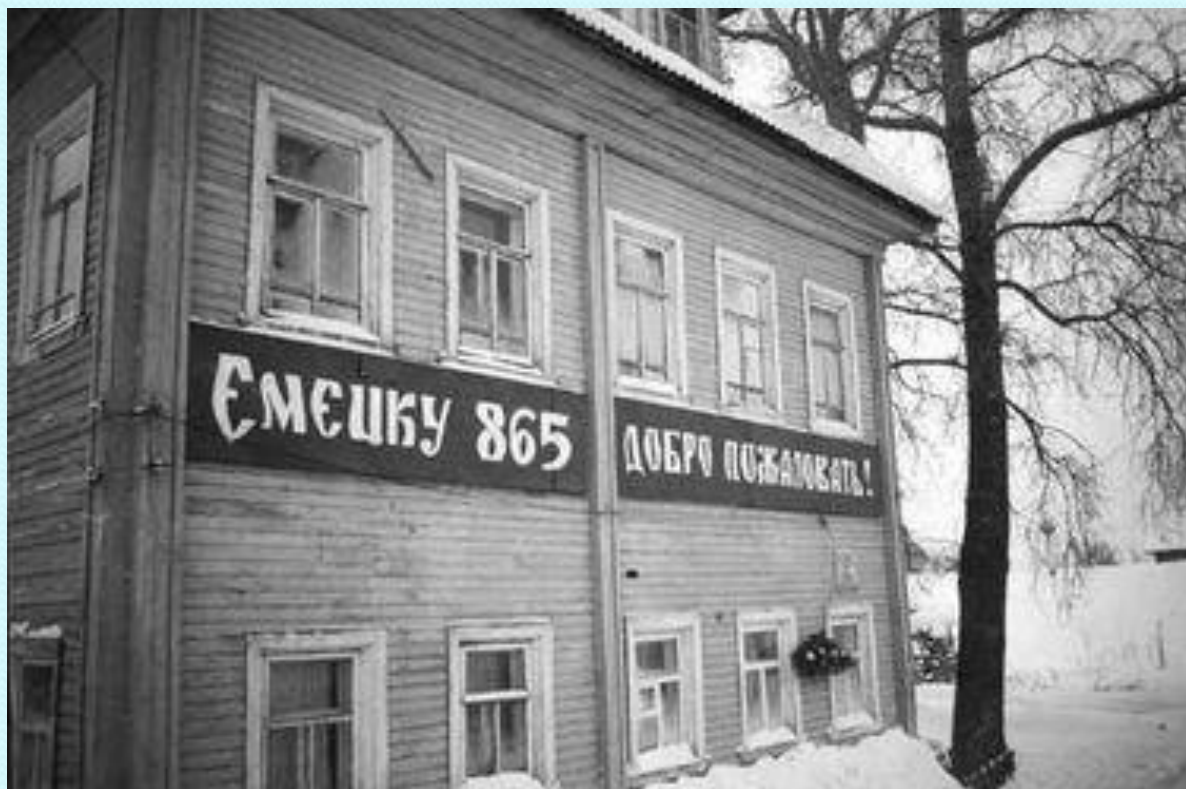
Дом в с. Емецк Архангельской области, где в 1936 г. родился Николай Рубцов