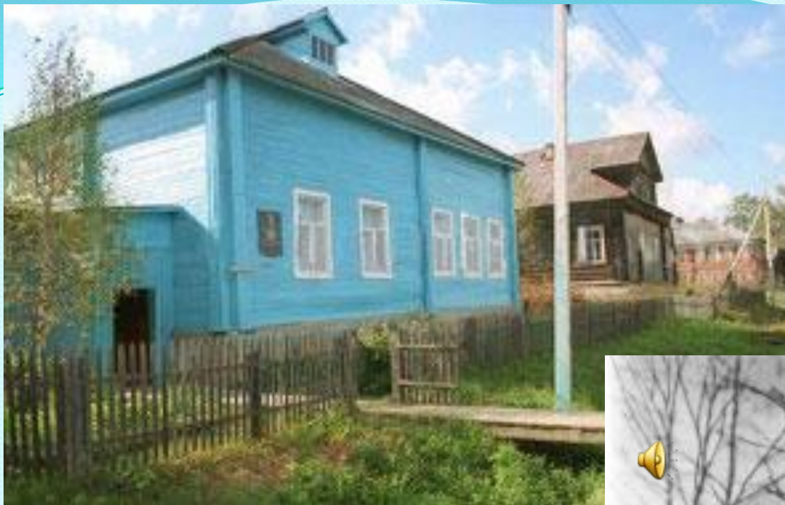
Музей Н. М. Рубцова в Никольском