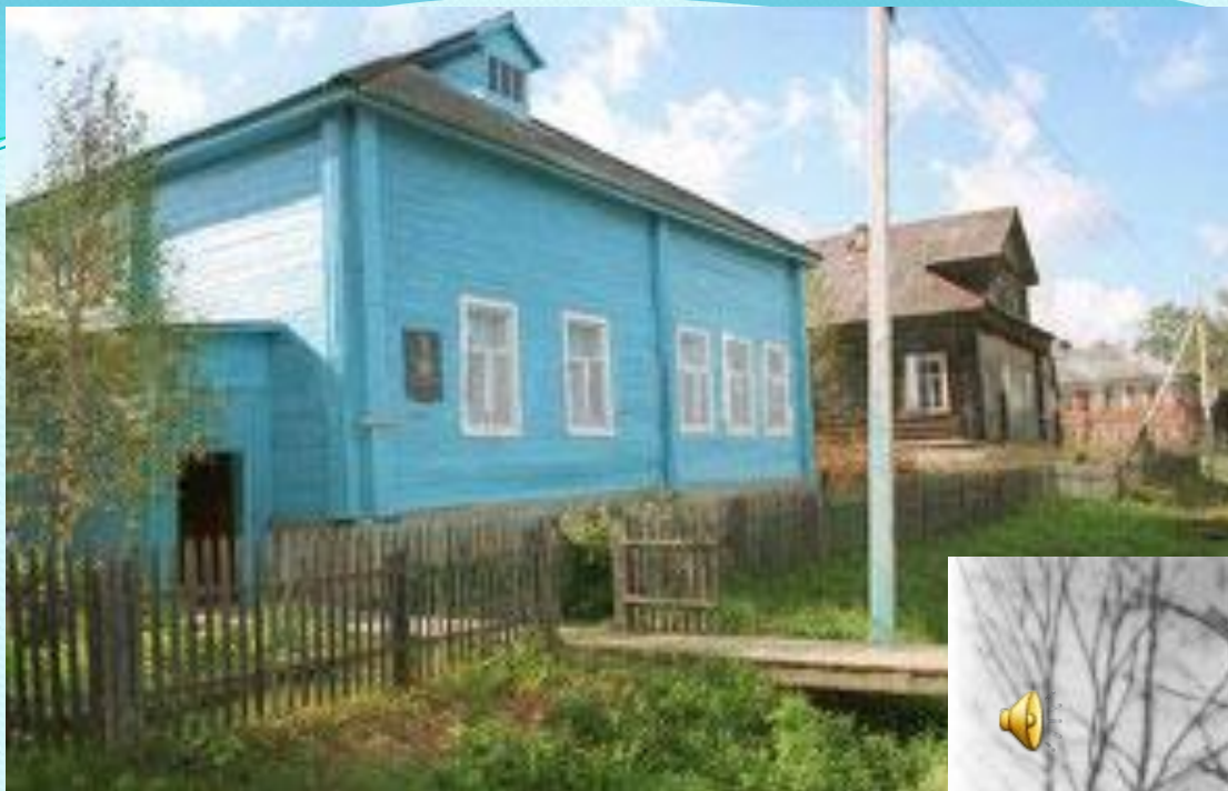
Музей Н. М. Рубцова в Никольском