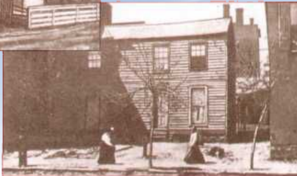
Школа в Ганнибале