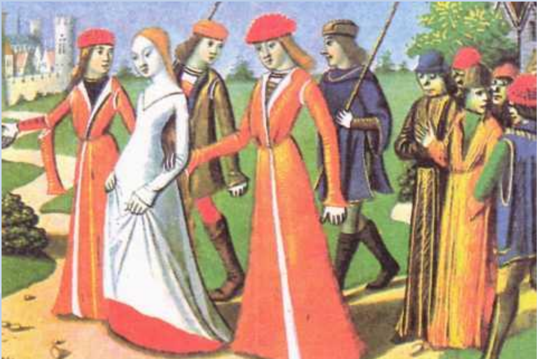
Жанна д'Арк (1412—1431) Орлеанская дева, воительница, возглавлявшая французов в войне с англичанами во время Семилетней войны