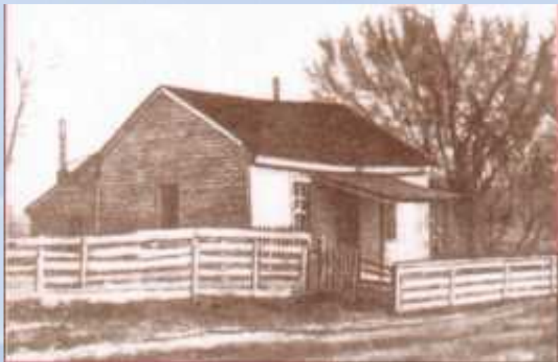
Дом в поселке Флорида, штат Миссури, где родился Сэмюэль Клеменс

достаточная, чтобы корабль не сел на мель. Одолевать реку ночью, в половодье, когда она меняет свое русло, — это был вызов для молодого лоцмана. Река открывала путь в огромный мир.