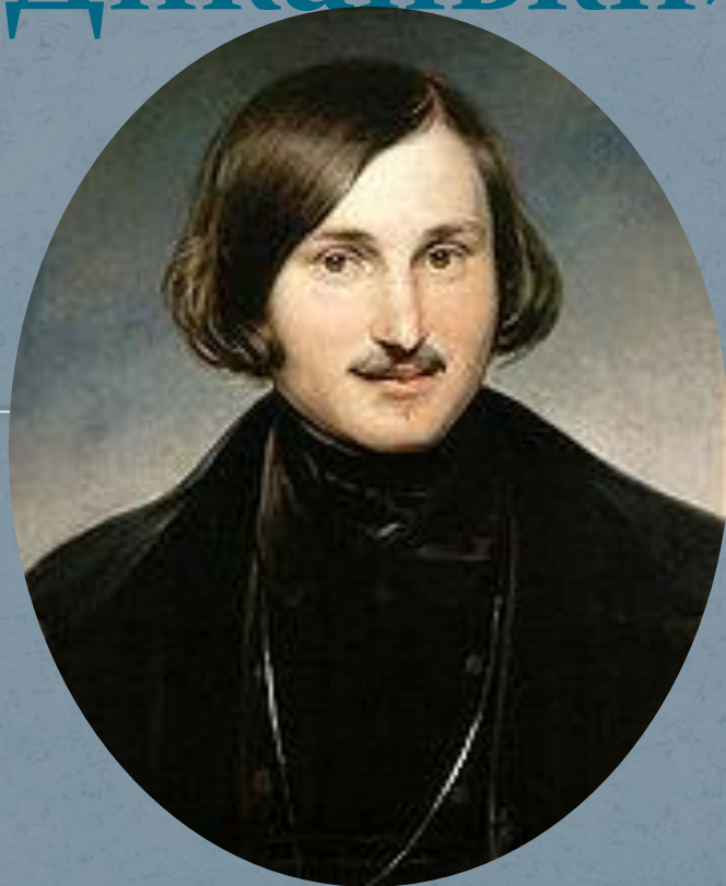
Н. В. Гоголь