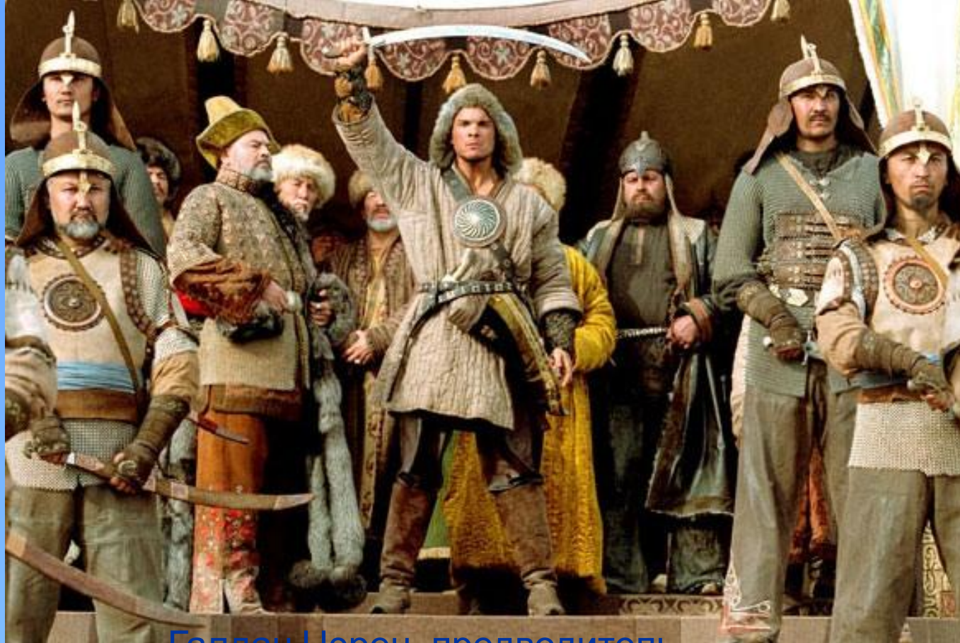
Галдан Цэрен- предводитель джунгар

Только объединив усилия трех жузов, казахский народ отразил нашествие джунгар, с честью прошел самые страшные испытания времен "Великого бедствия" в первой половине XVIII века, сумел отстоять свою землю, сохранить себя как народ и выйти из испытаний окрепшим.