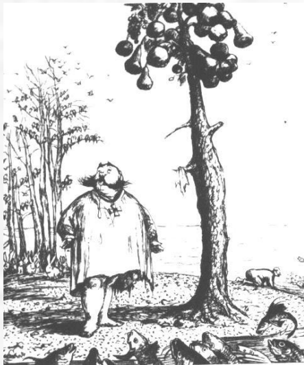
"Повесть о том, как один мужик двух генералов прокормил"

Над книгой «Сказок» Салтыков-Щедрин работал с 1882 по 1886 год.