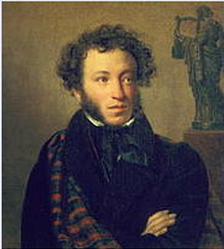
А. С. Пушкин. Портрет работы О. А. Кипренского (1827).

При всем своеобразии пушкинской трактовки она восстанавливает некоторые детали как пьесы Тирсо де Молины — заглавие и выходящий на первый план мотив расплаты, так и античного мифа о мстящей статуе. То, что нередко воспринималось как особая дерзость и рискованность пушкинского замысла, свидетельство особой безнравственности его героя, — приглашение Дон Гуаном Командора, превращенного Пушкиным из отца в мужа Доны Анны, позволило ввести в пьесу мотив мести из ревности, коль скоро статуя разъединяет влюбленных. Мотив мстящей статуи, разлучающей влюбленных в «Каменном госте», оказывается особенно выразительным в связи с тем, что при расплате присутствует именно Дона Анна, а не слуга Лепорелло (как у Моцарта) или Станарель (как у Мольера).