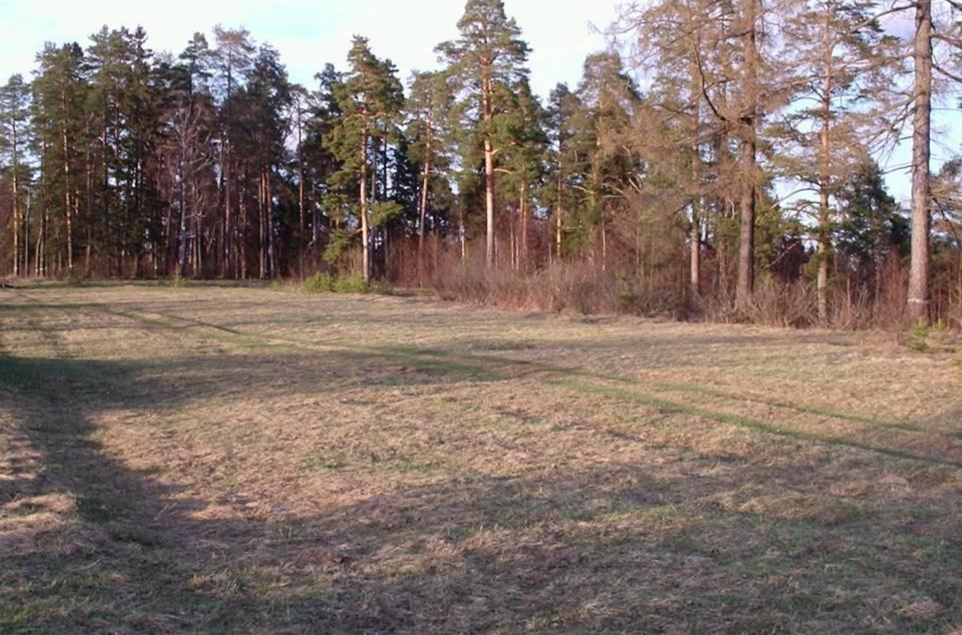
Месторасположение старого усадебного дома. Сохранилась планировка фундамента.