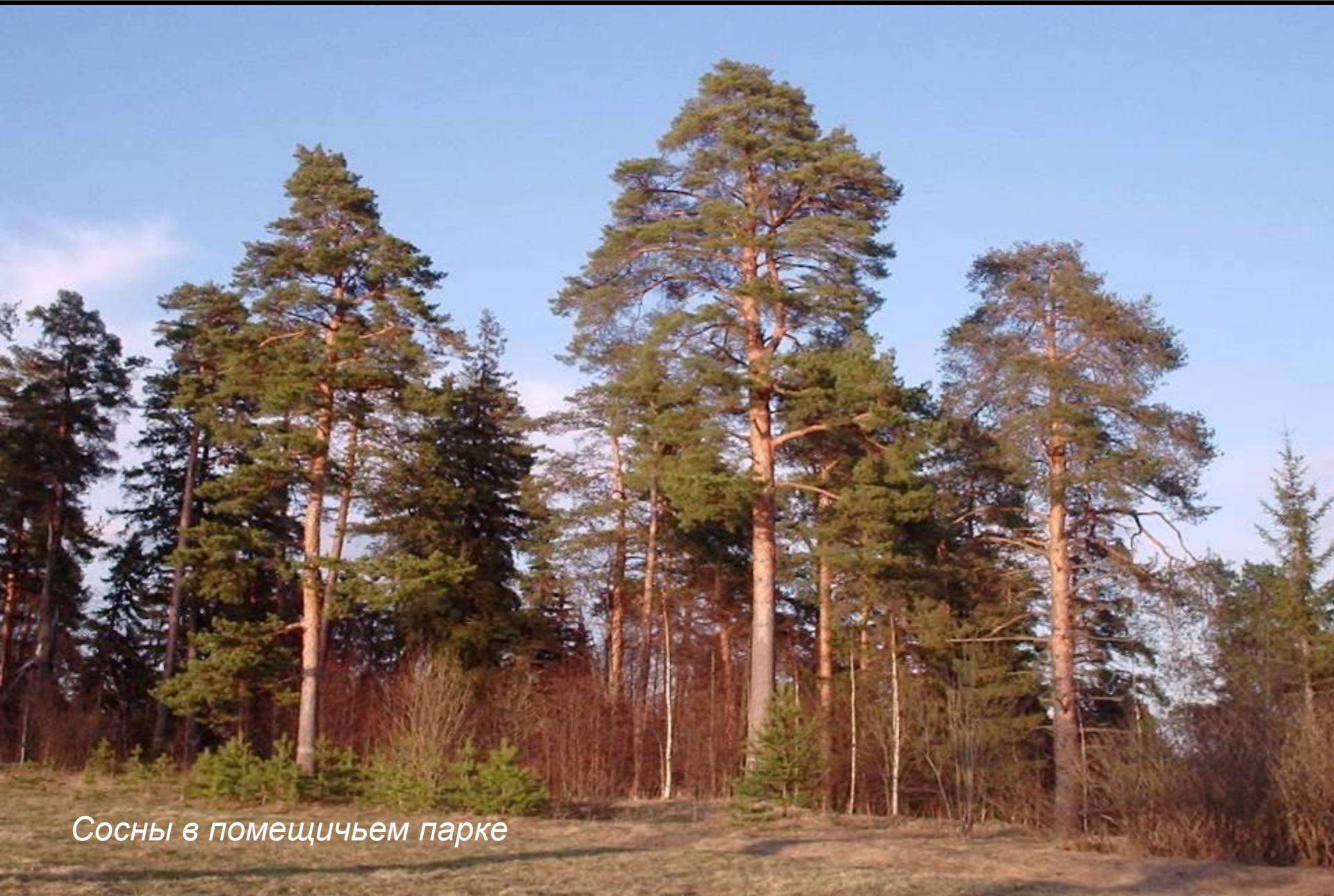
Сосны в помещичьем парке