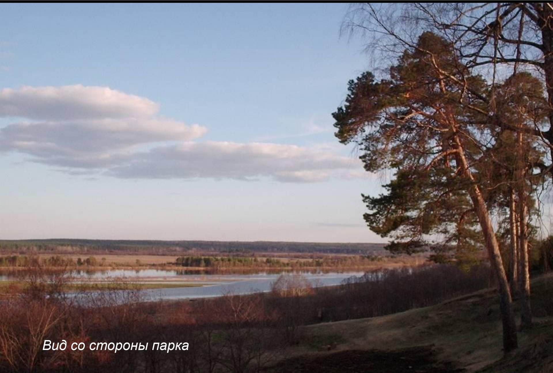
Вид со стороны парка