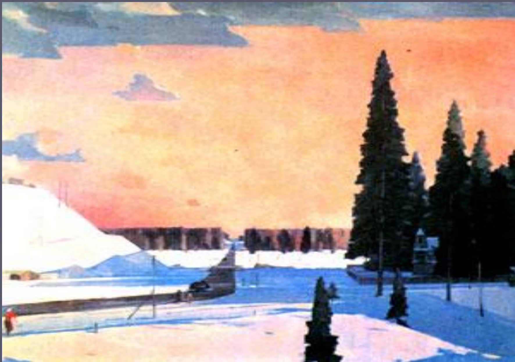
Г.И.Нисский «Февраль. Подмосковье»