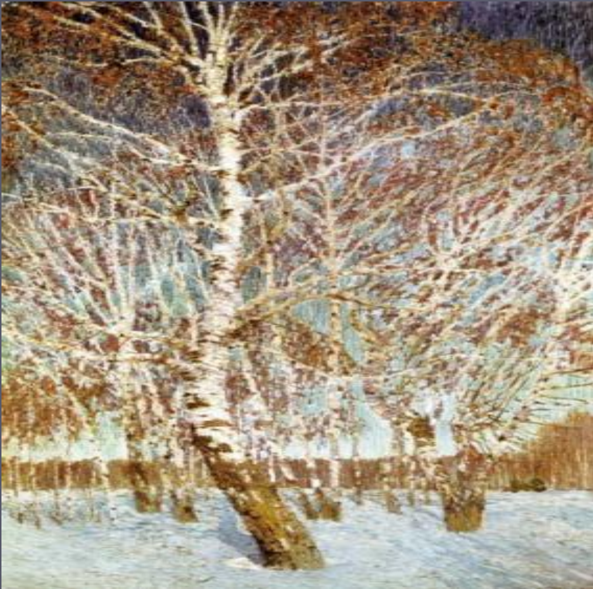
И. Грабарь «Февральская лазурь»