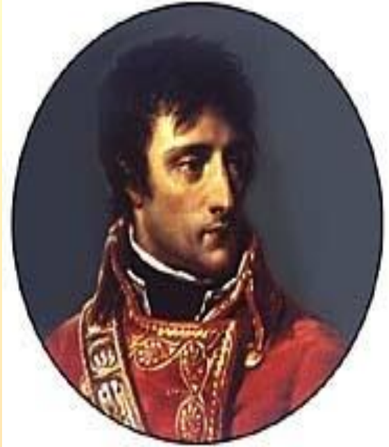
Наполеон Бонапарт – французский государственный деятедь, полководец.