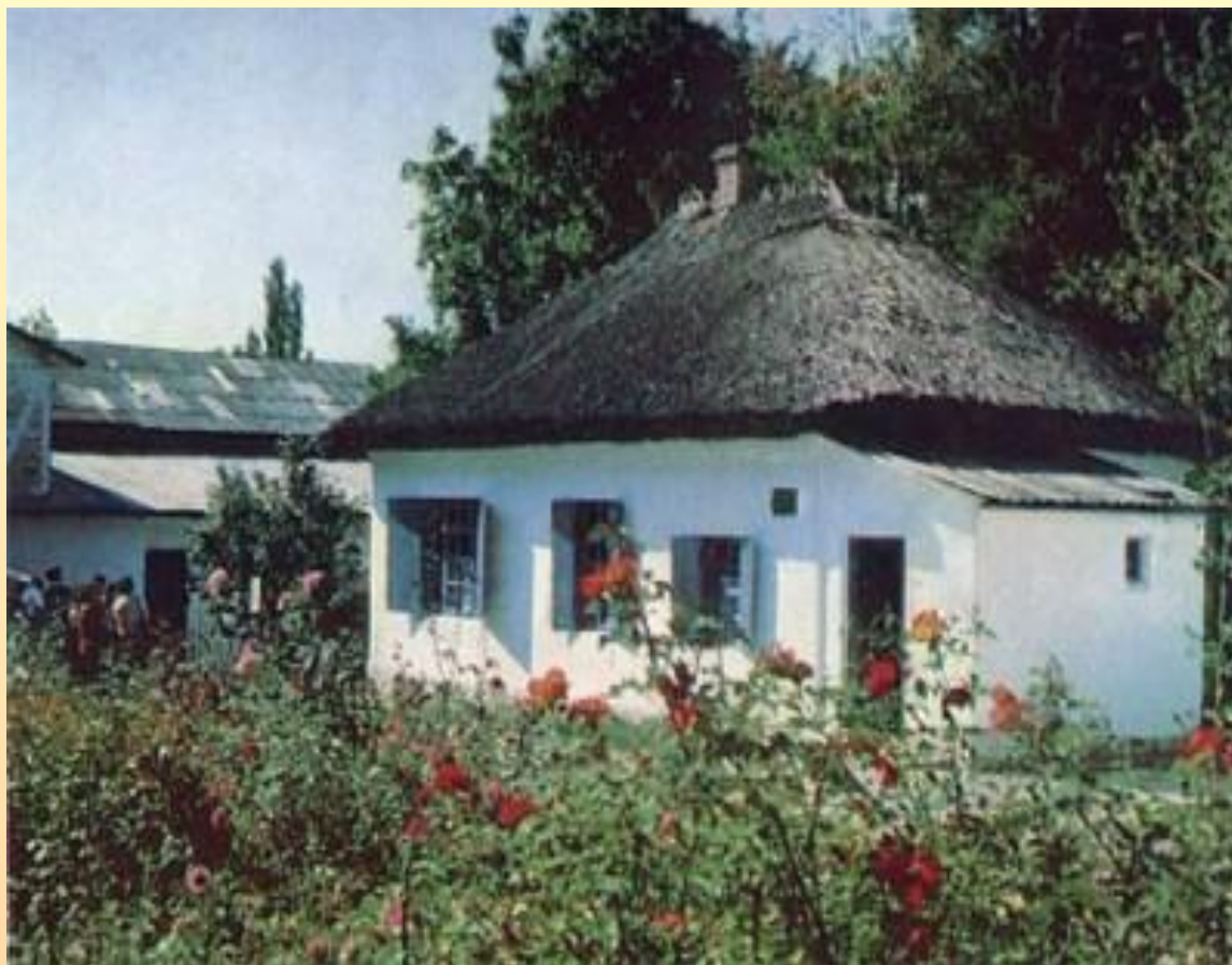
Пятигорск, домик М.Ю. Лермонтова