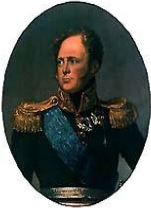
Александр I – российский император.