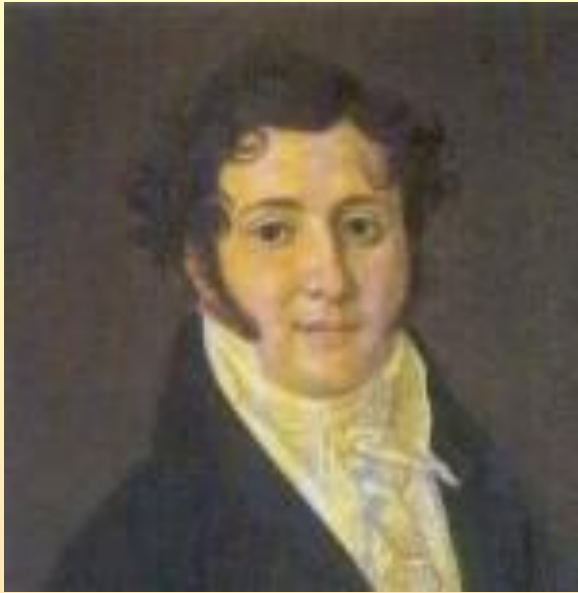
Юрий Петрович Лермонтов