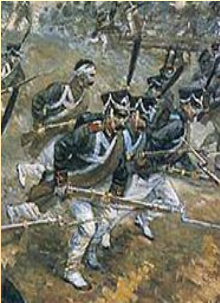
А.Клерман «Атака при селе Бородино».