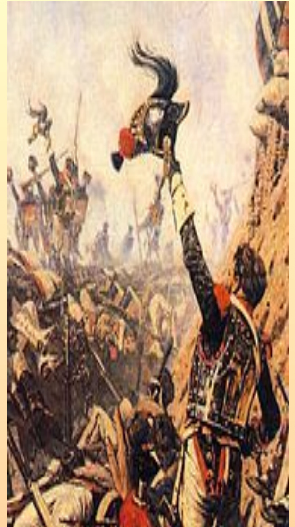
В.В.Верещагин. «Конец Бородинского сражения».