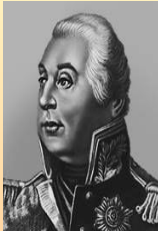
Кутузов Михаил Илларионович – русский полководец.