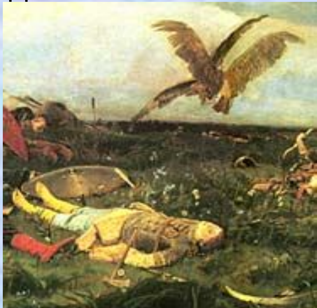
«После побоища Игоря Святославича с половцами»