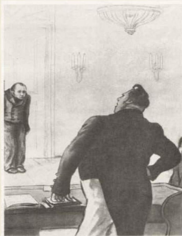
71. Акакий Акакиевич у значительного лица Художники Кукрыниксы, 1952 г., б., черная акварель