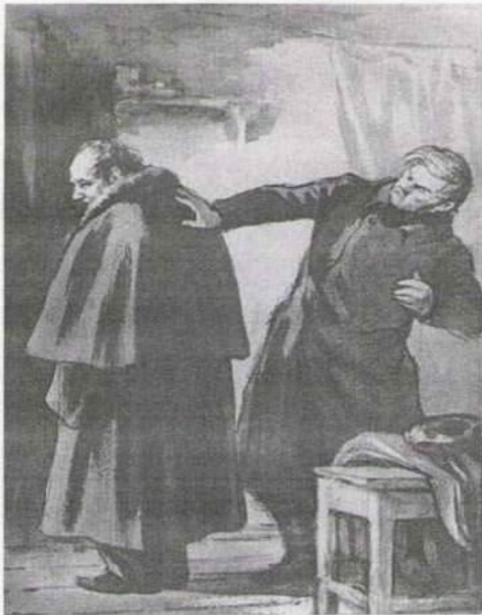
70. Акакий Акакиевич примеряет новую шинель Художники Кузрыньские, 1952 г., в., черная акварель