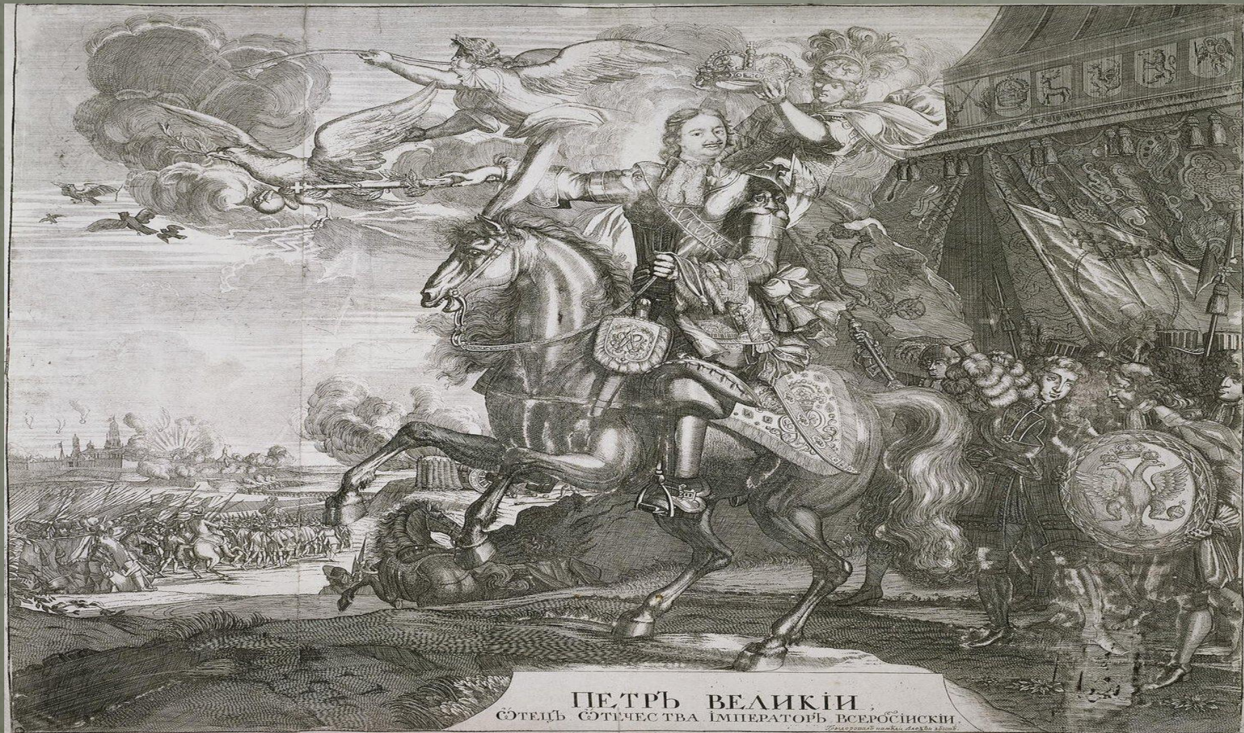
ПЕТРЪ ВЕЛИКІИ СѢТЕЦЪ СѢТЕЧЕС ТВА ІМПЕРАТОРЪ ВСЕРОСІНСКІИ.