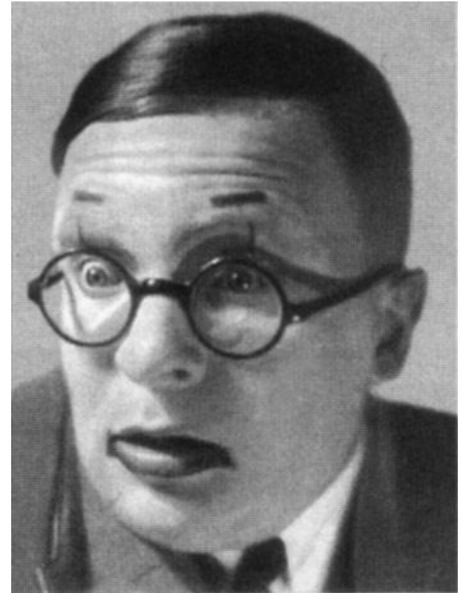
Максим Штраух в роли Победоносикова.