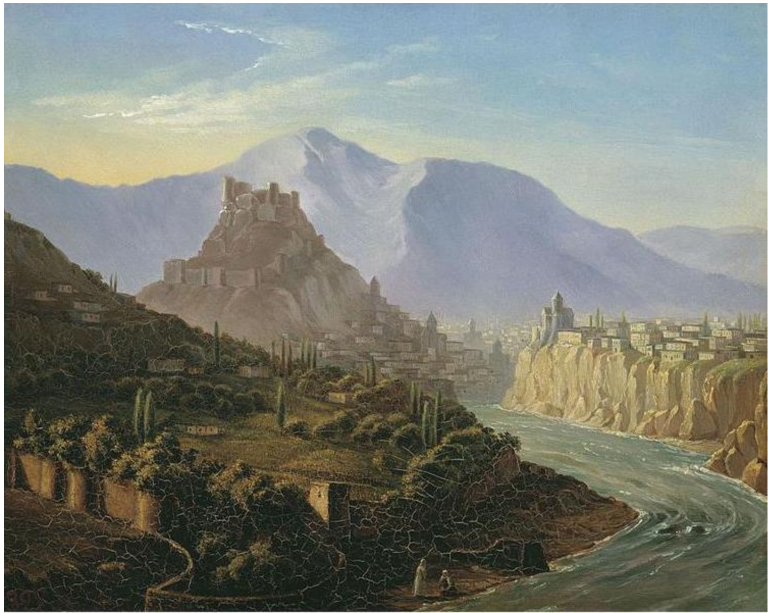
Вид Тифлиса. Масло. 1837