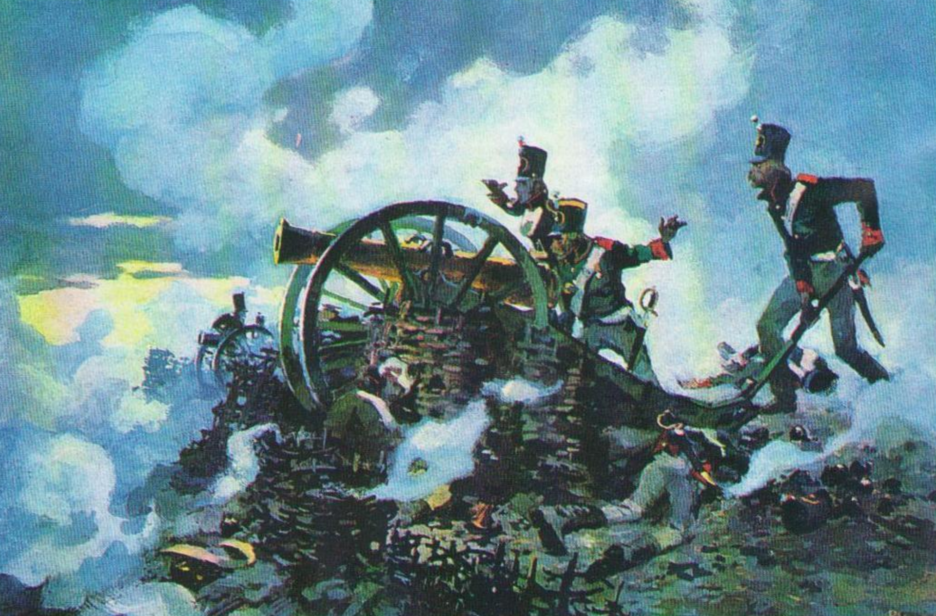
А. Николаев. Батарея Тушина