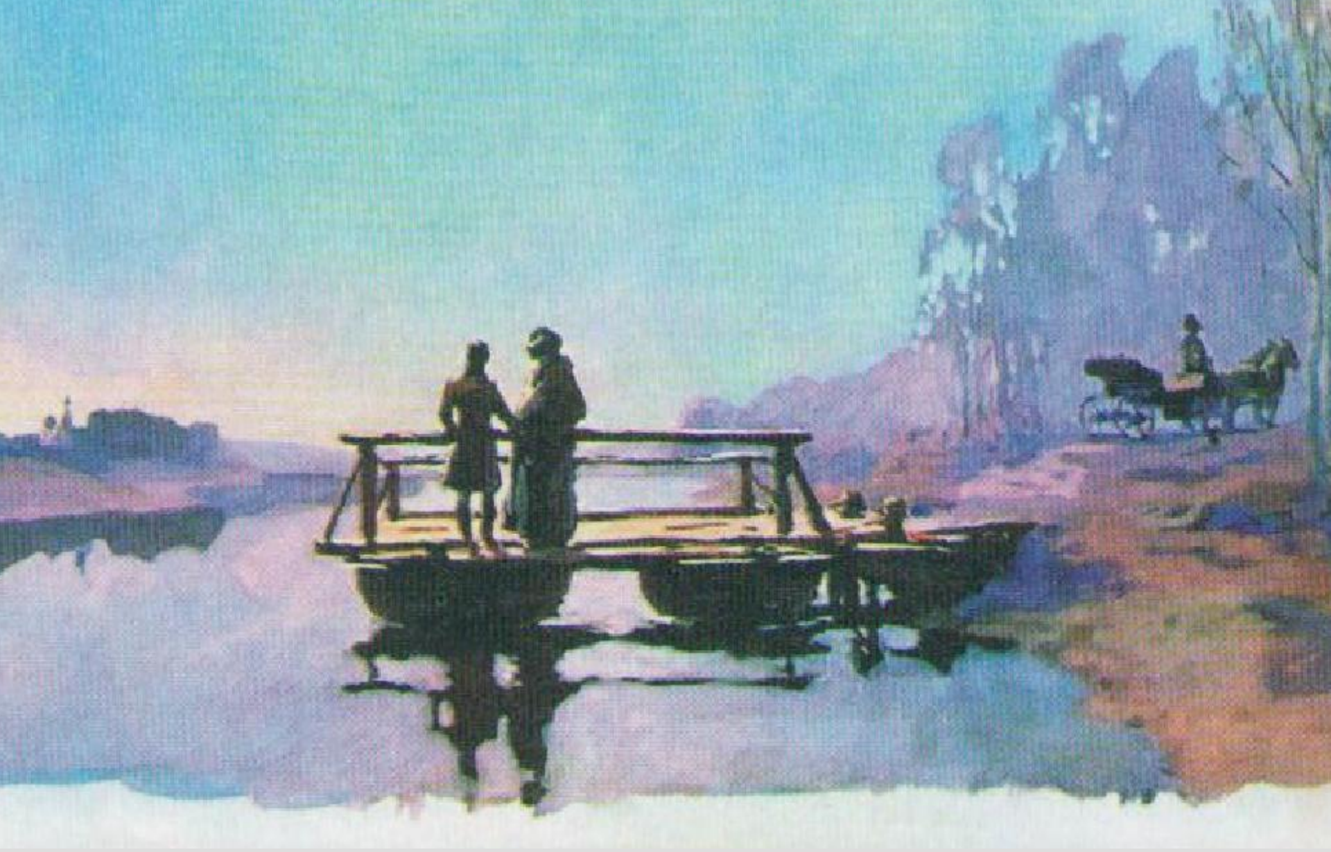
А.В. Николаев. Андрей и Пьер на пароходе. 1970