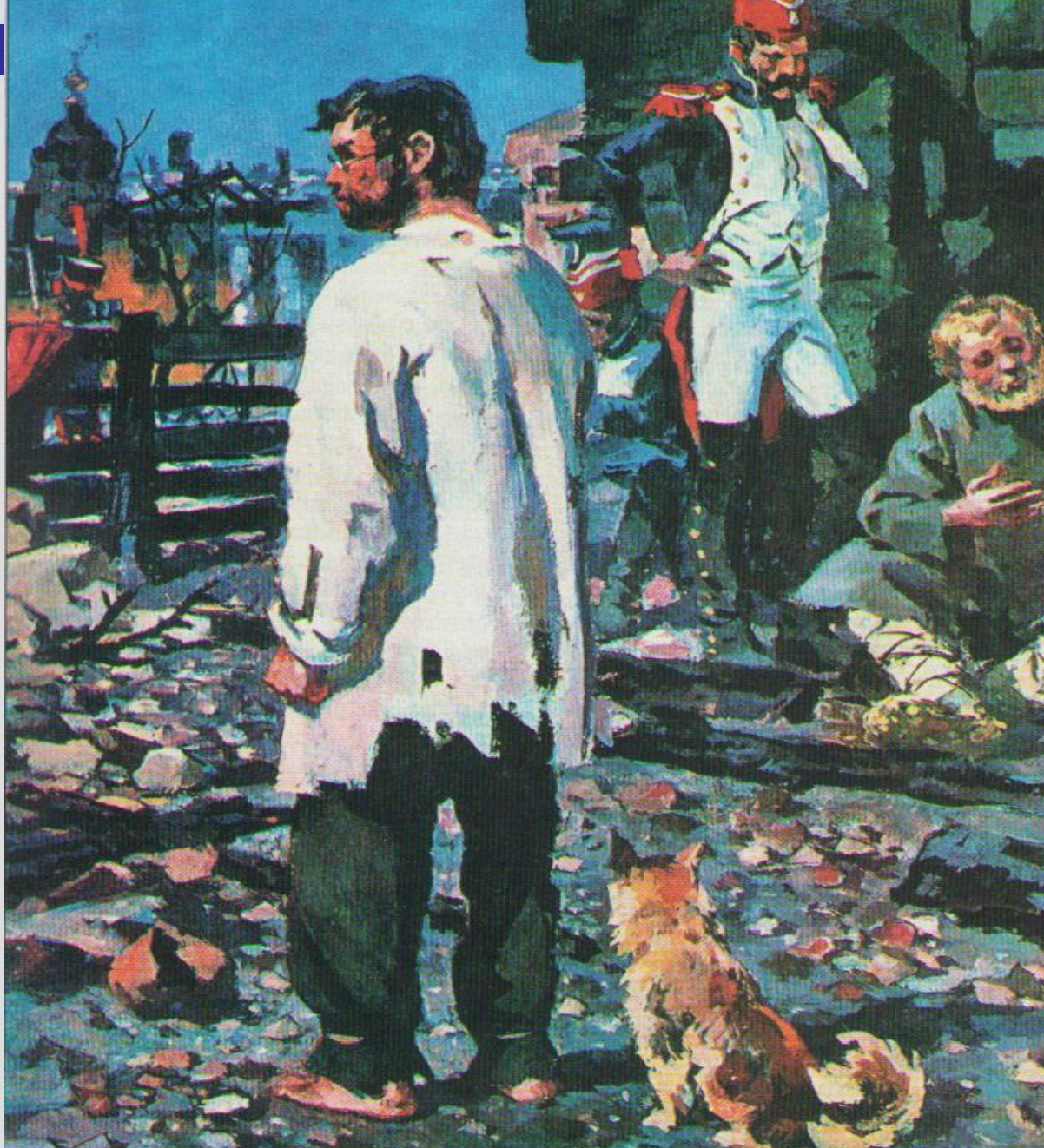
А. Николаев. Пьер в плену