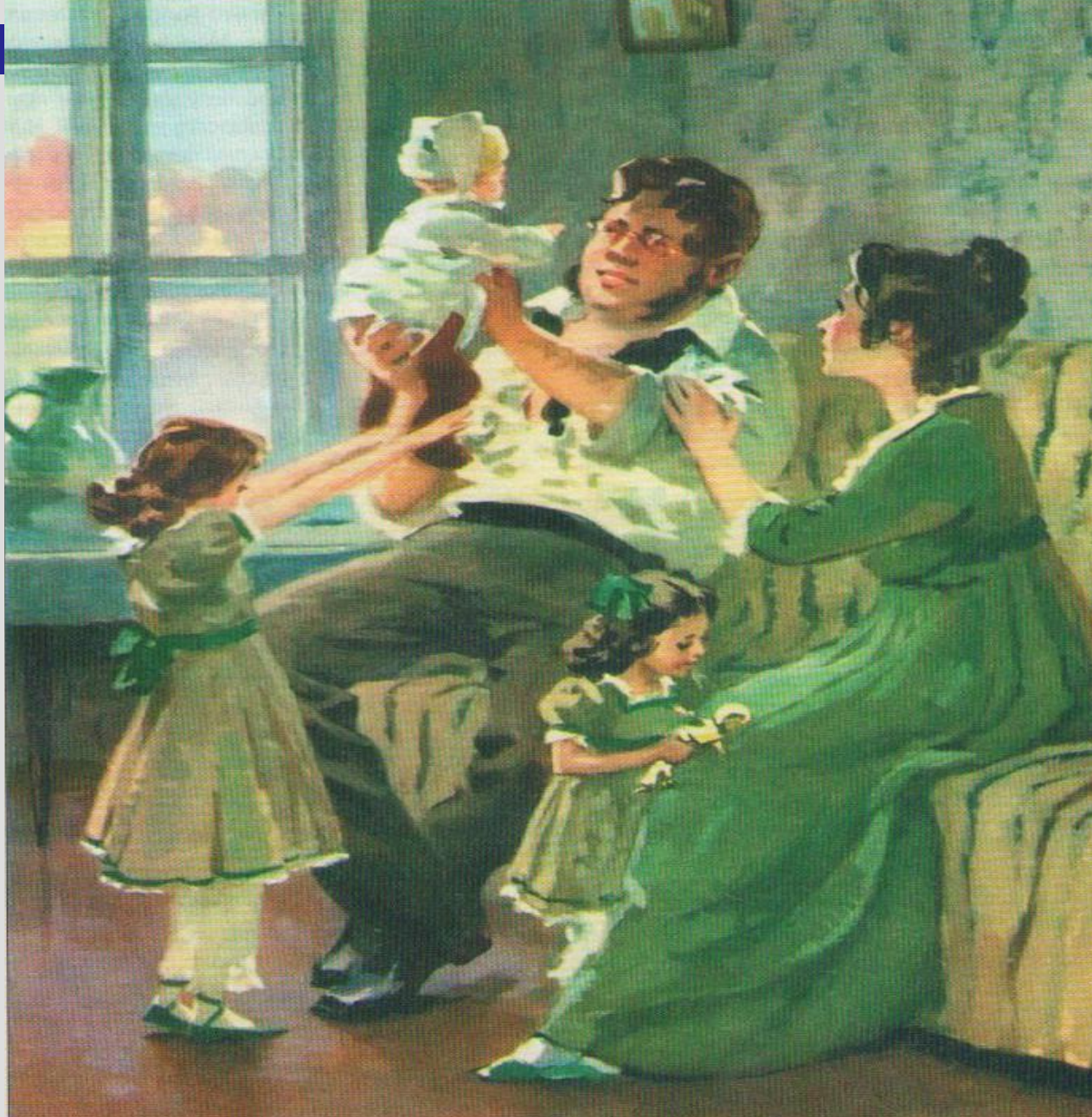
А. Николаев. Семья Безуховых. 1970 год