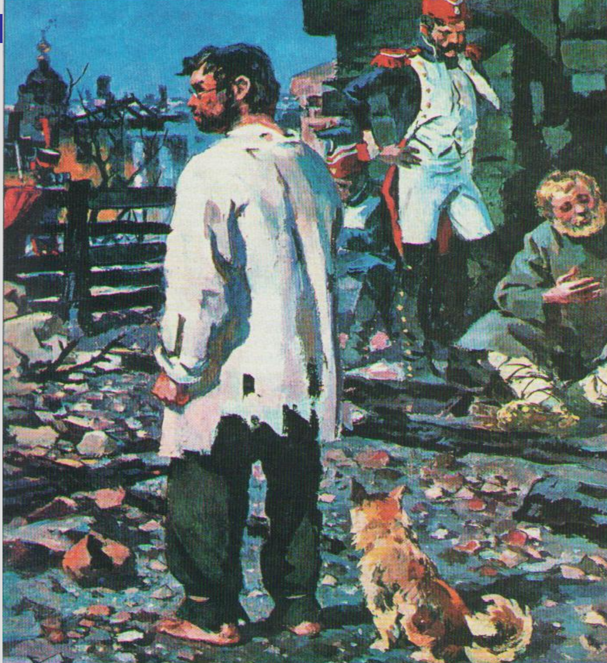
А. Николаев. Пьер в плену