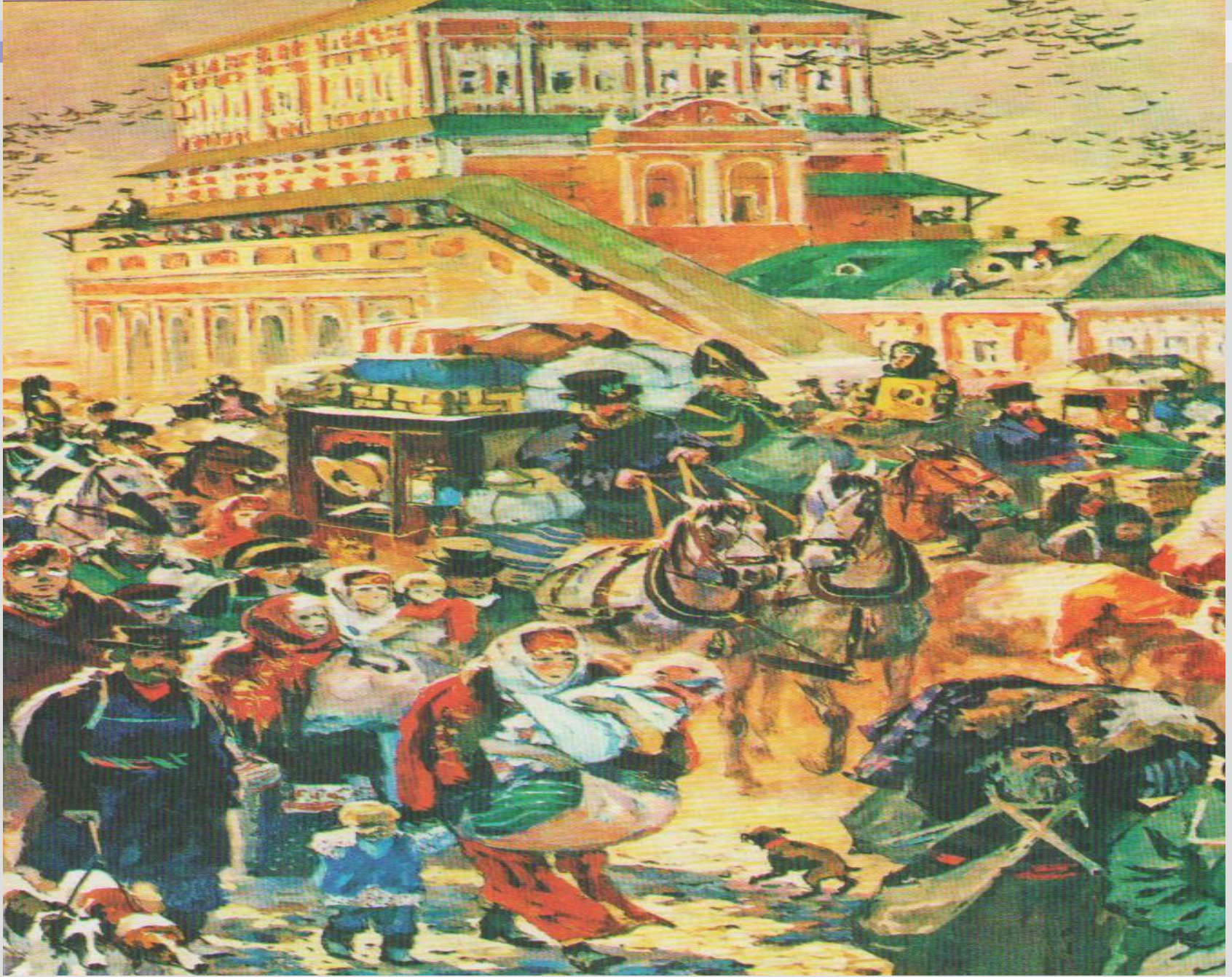
А. Николаев. Жители покидают Москву