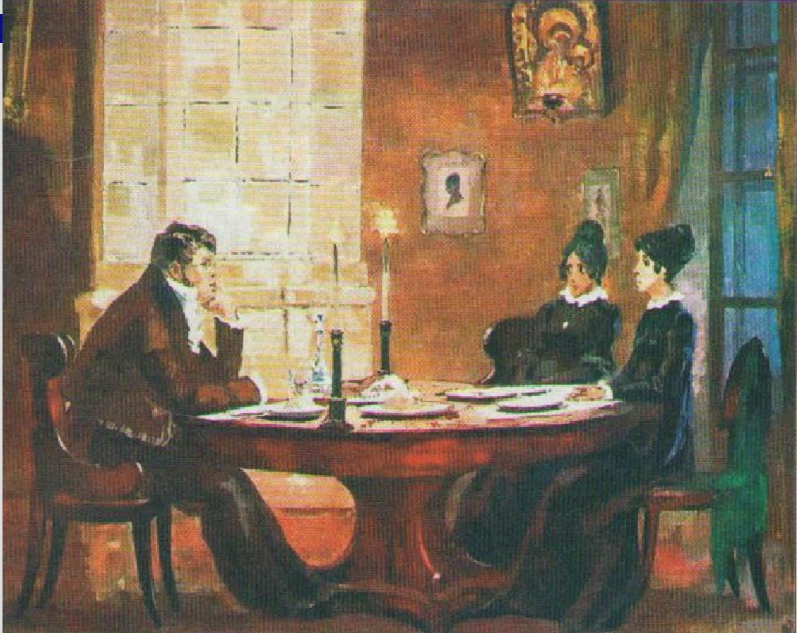
А. Николаев. Марья и Наташа слушают Пьера. 1970