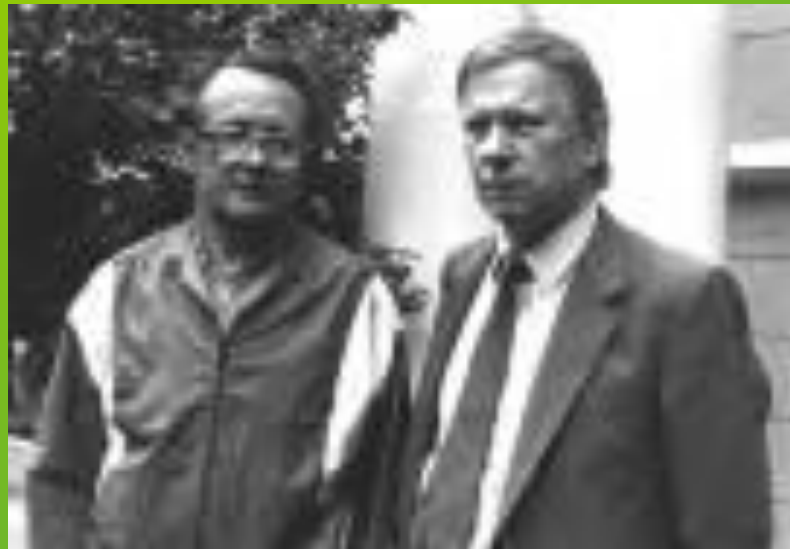
А.Адамович и В.Быков

Премия «За честь и мужество таланта» (1997; посмертно).