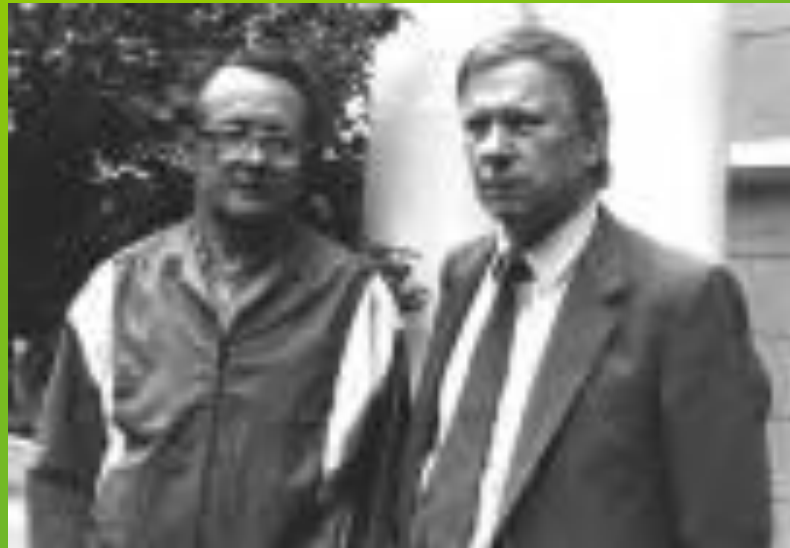
А.Адамович и В.Быков

Премия «За честь и мужество таланта» (1997; посмертно).