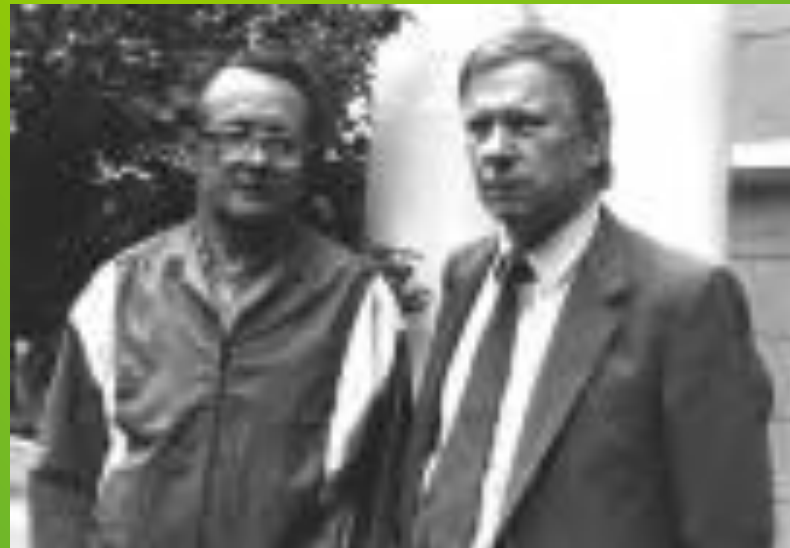
А.Адамович и В.Быков

Премия «За честь и мужество таланта» (1997; посмертно).