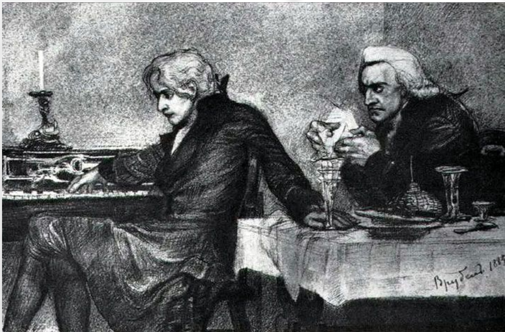
М.А.Врубель. Иллюстрация к трагедии «Моцарт и Сальери. Яд.