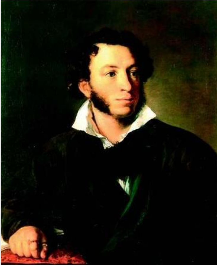
Александр Сергеевич Пушкин Художник В.А.Тропинин