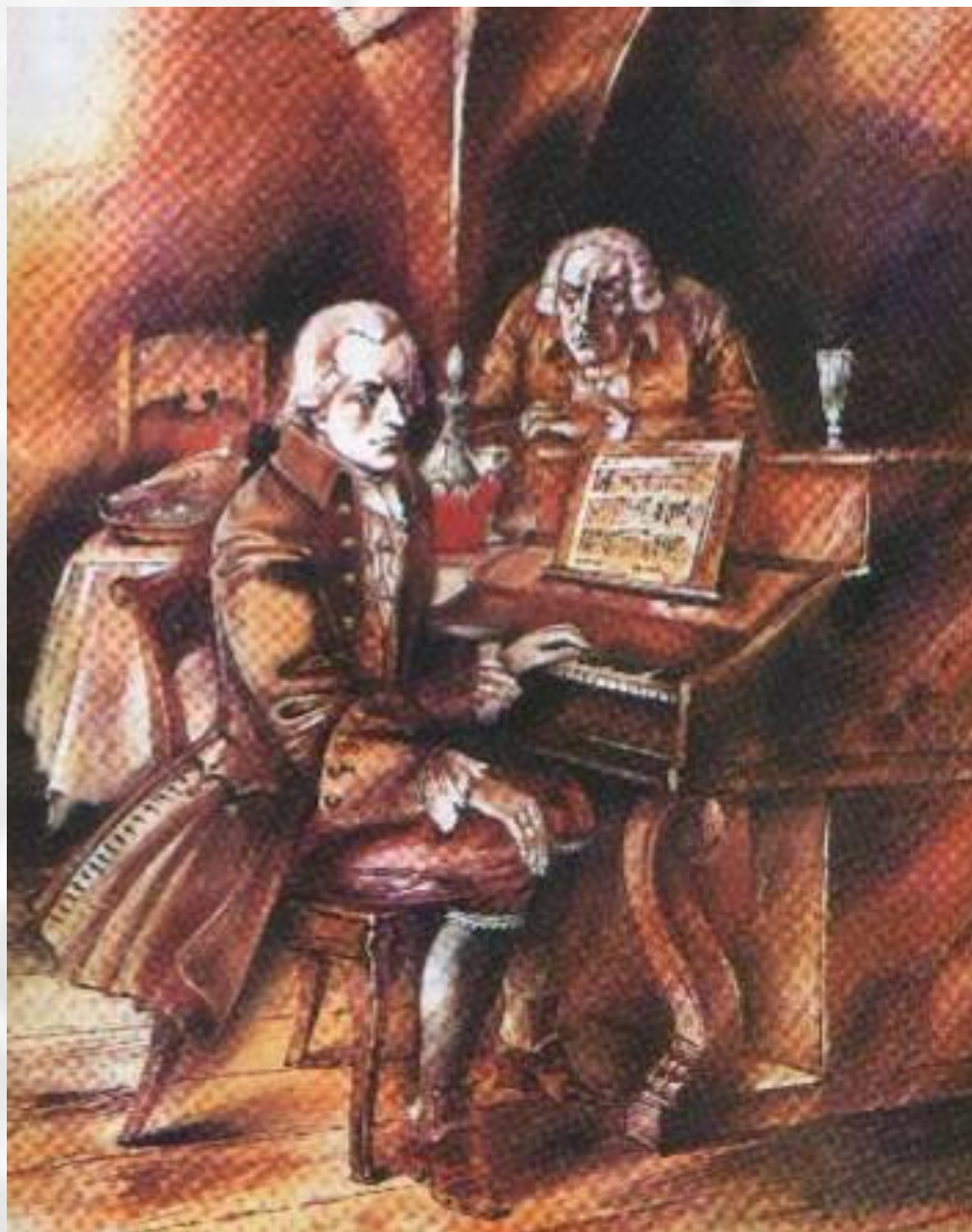
А.Борисов. Иллюстрация к трагедии «Моцарт и Сальери»