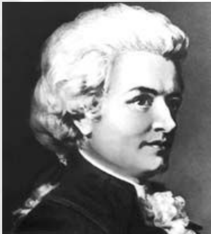
Вольфганг Амадей Моцарт