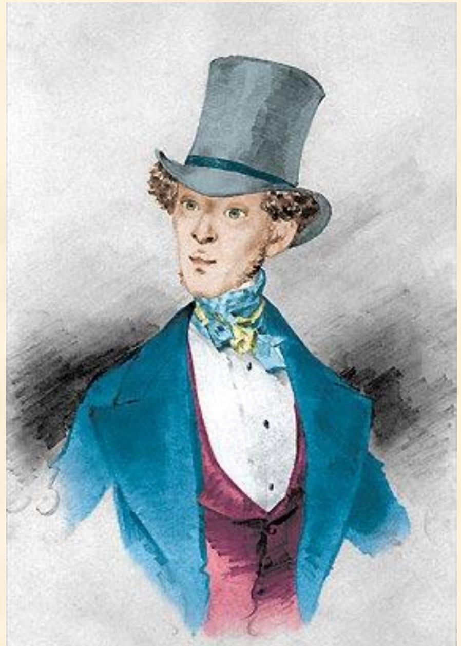
12. Иван Александрович Хлестаков, чиновник из Петербурга.