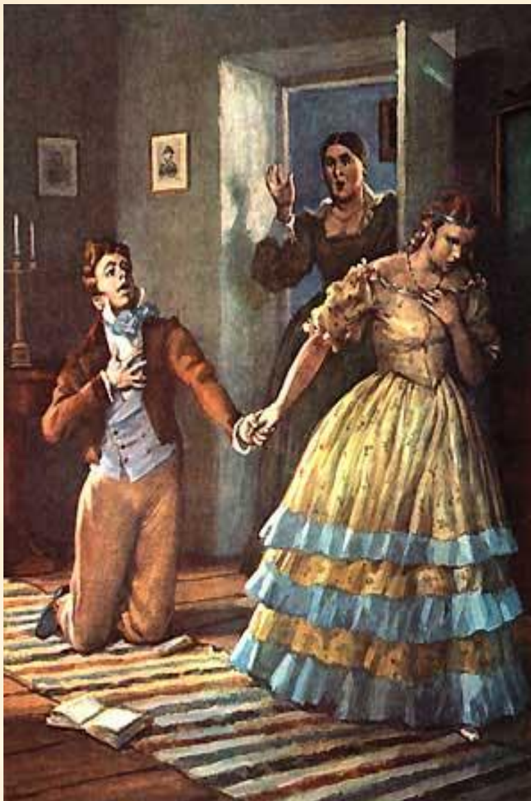
15. Объяснение в любви