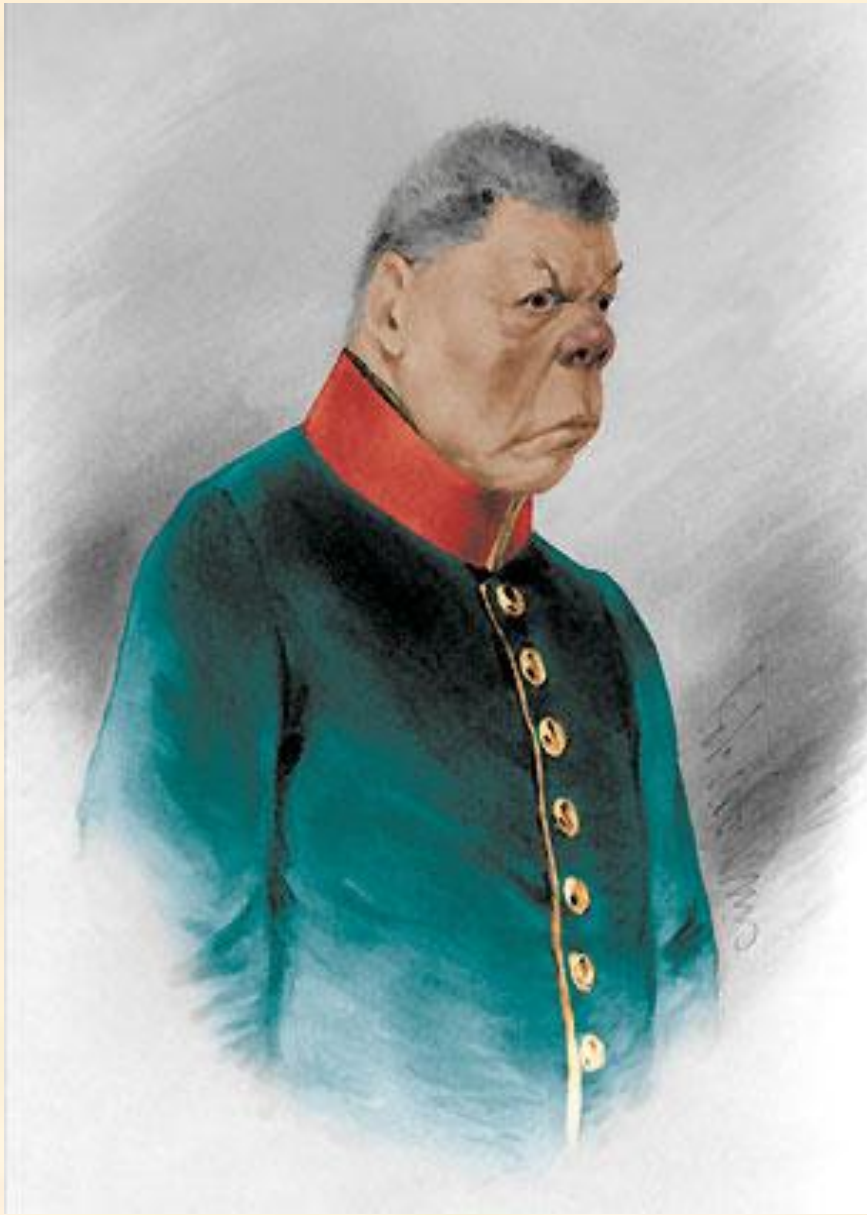
11. Держиморда, полицейский