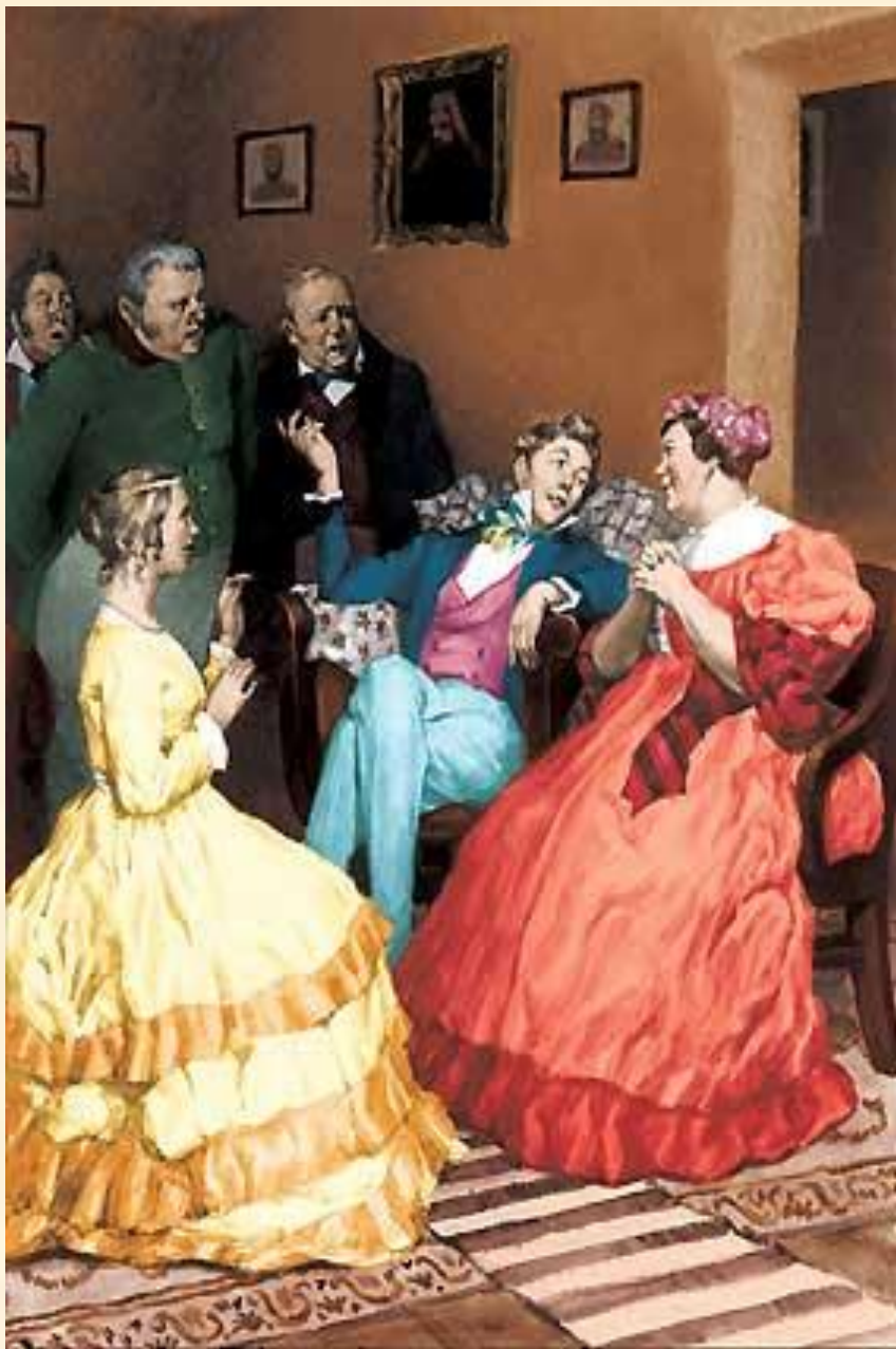
13. Сцена вранья