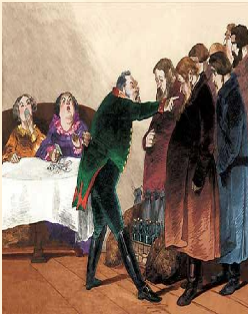
16. Торжество Городничего. Разговор с купцами