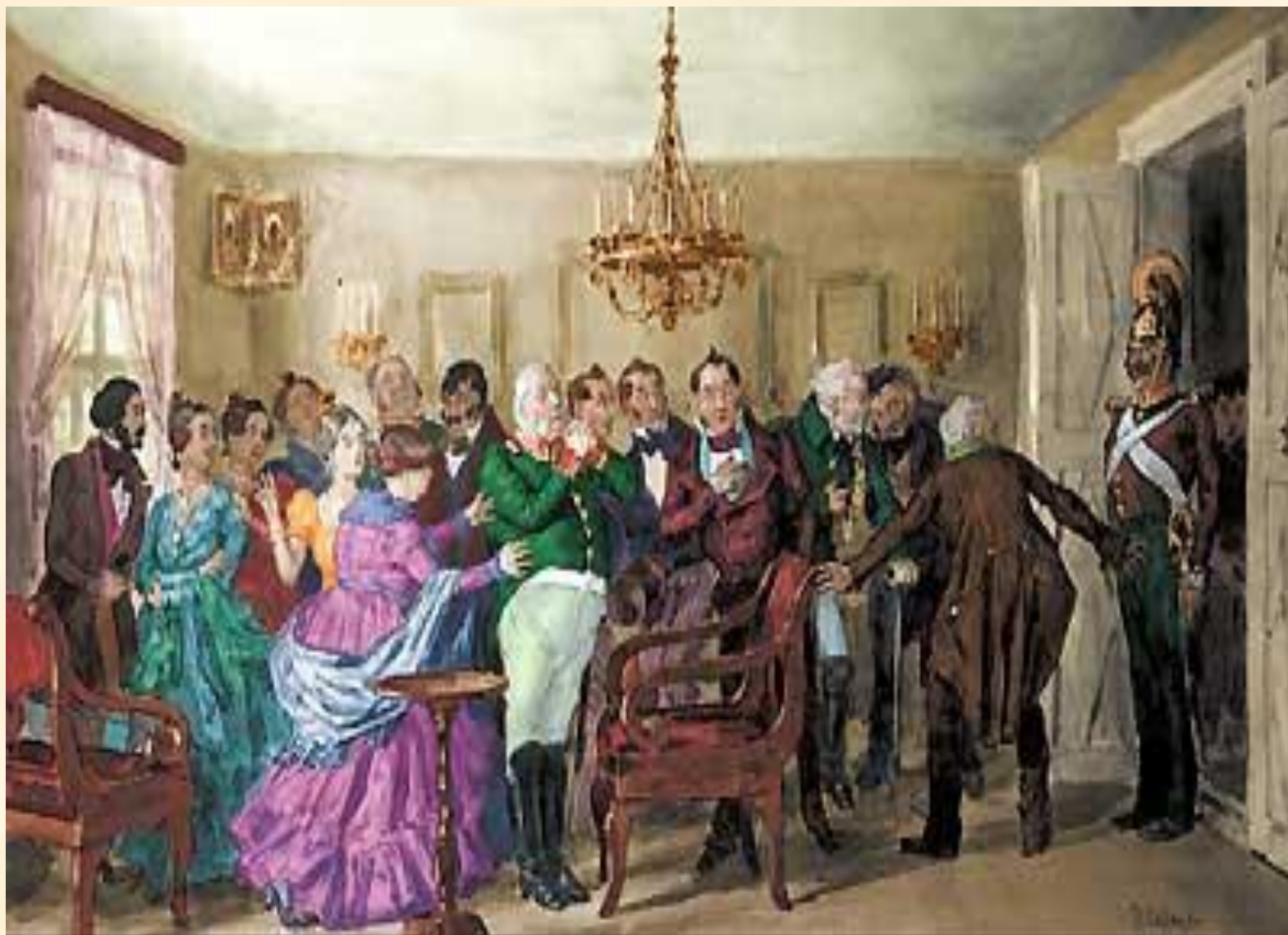
19. Немая сцена