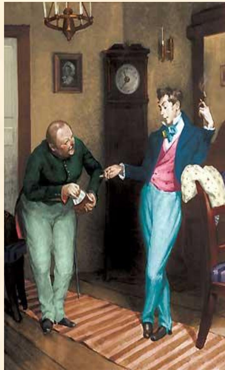
14. Хлестаков и Земляника