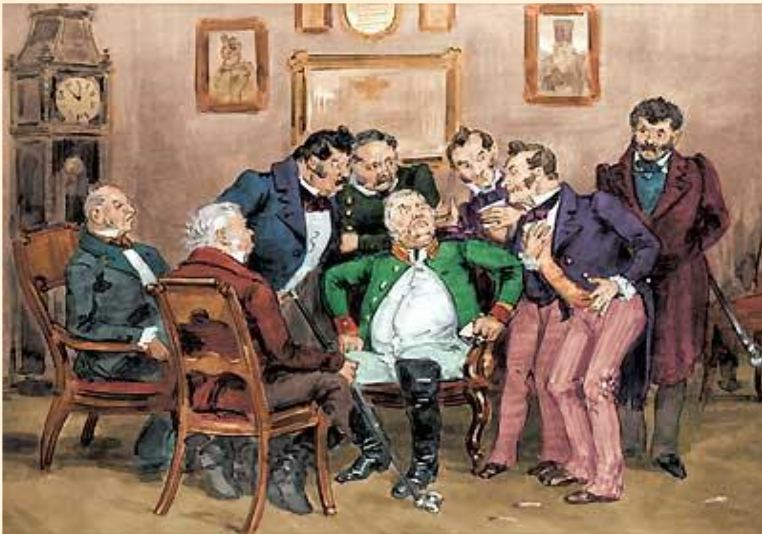
17. Чиновники обсуждают письмо Хлестакова