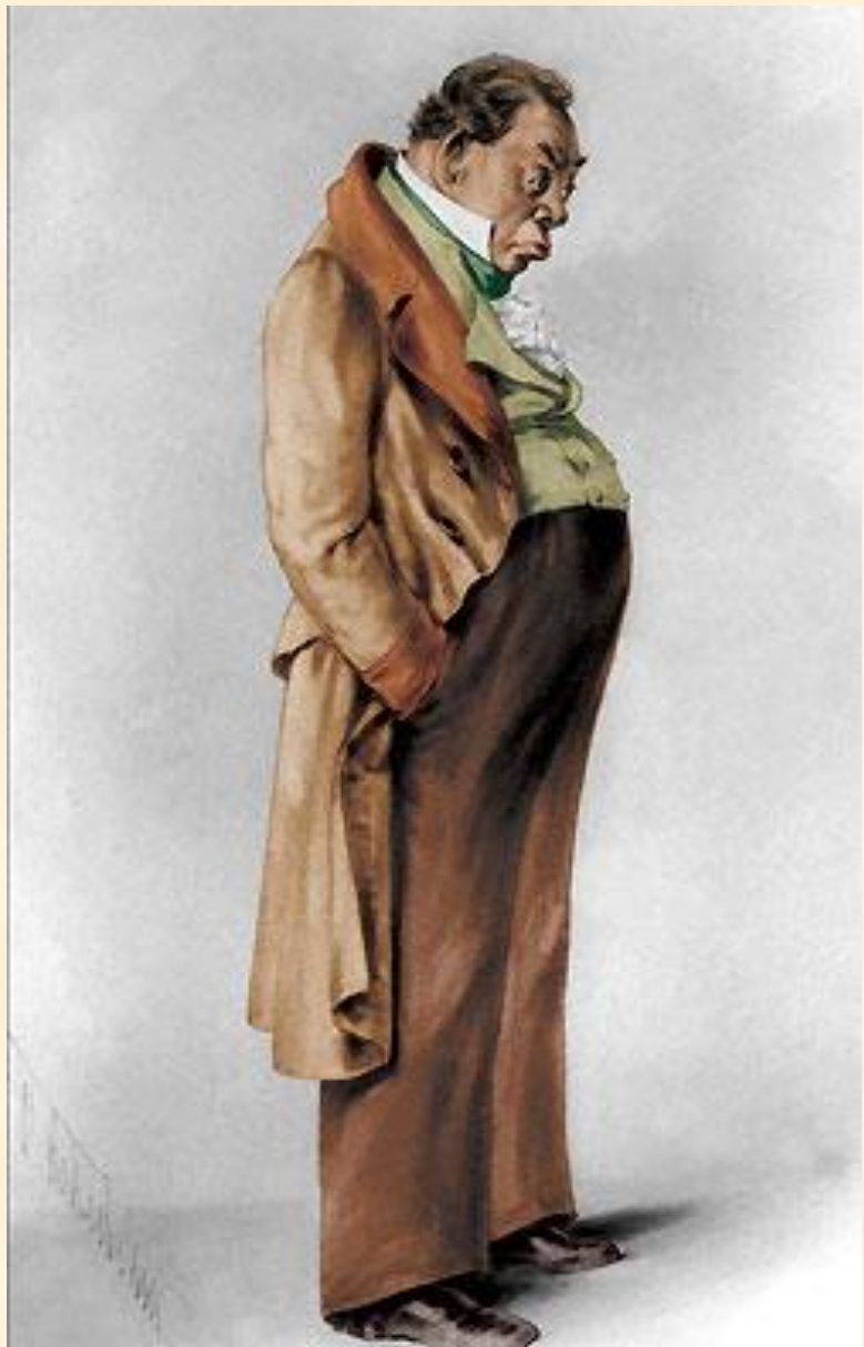
5. Аммос Федорович Ляпкин-Тяпкин, судья.