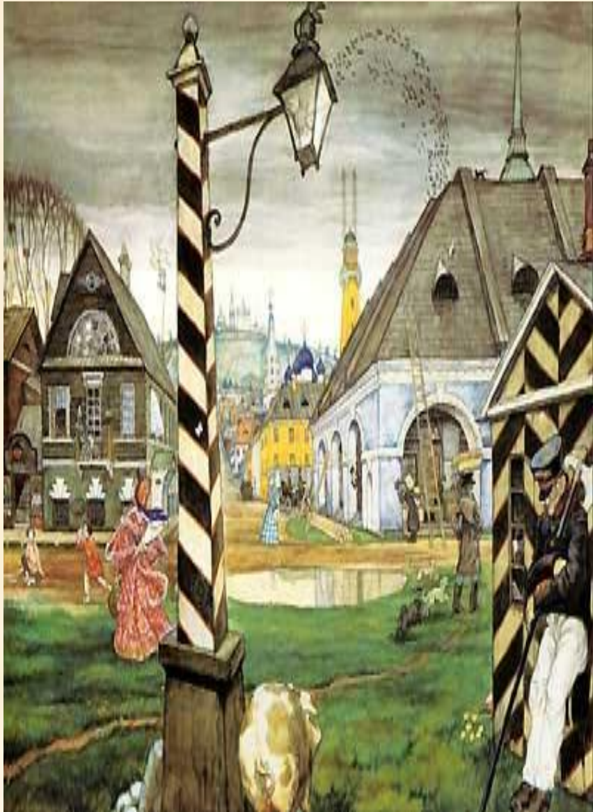
2. Провинциальный город