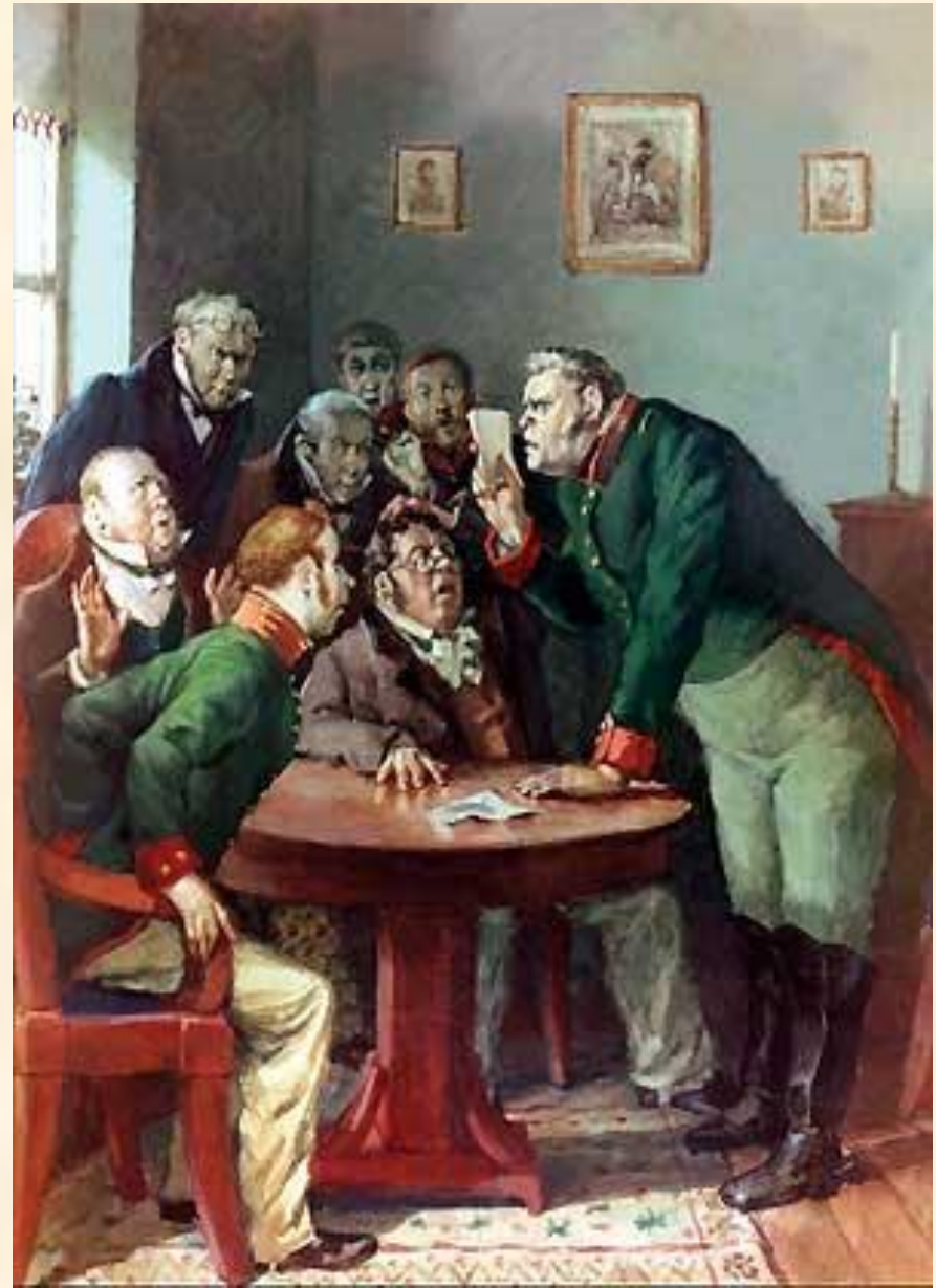
3. Завязка комедии