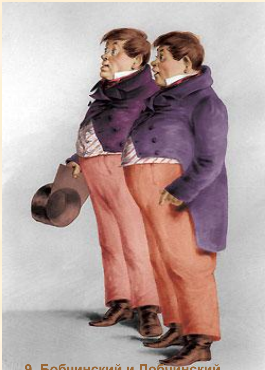
9. Бобчинский и Добчинский