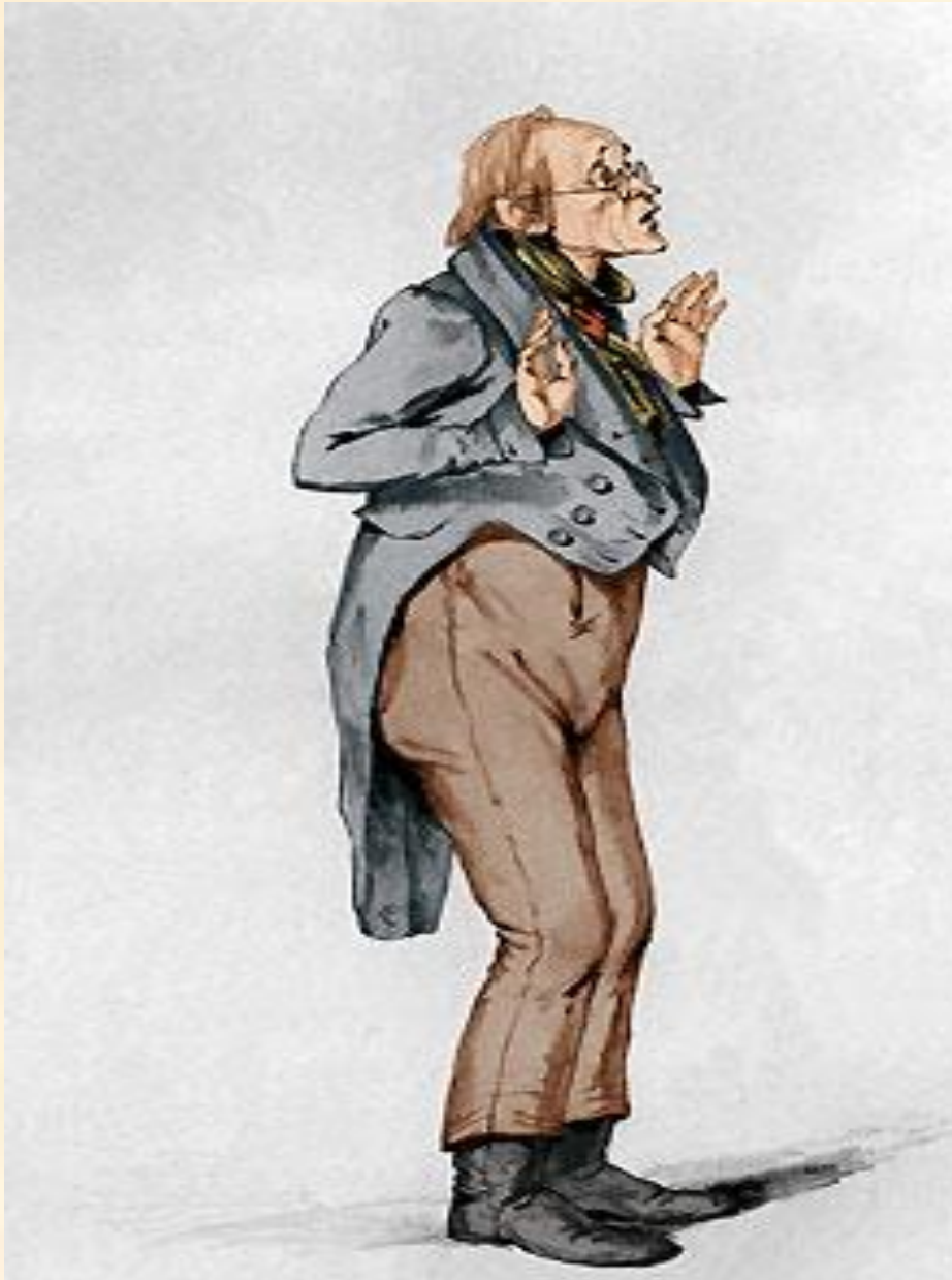
7. Лука Лукич Хлопов, смотритель училищ