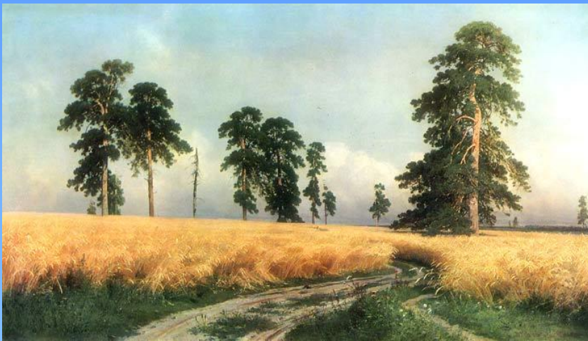
Иван Иванович Шишкин «Рожь»