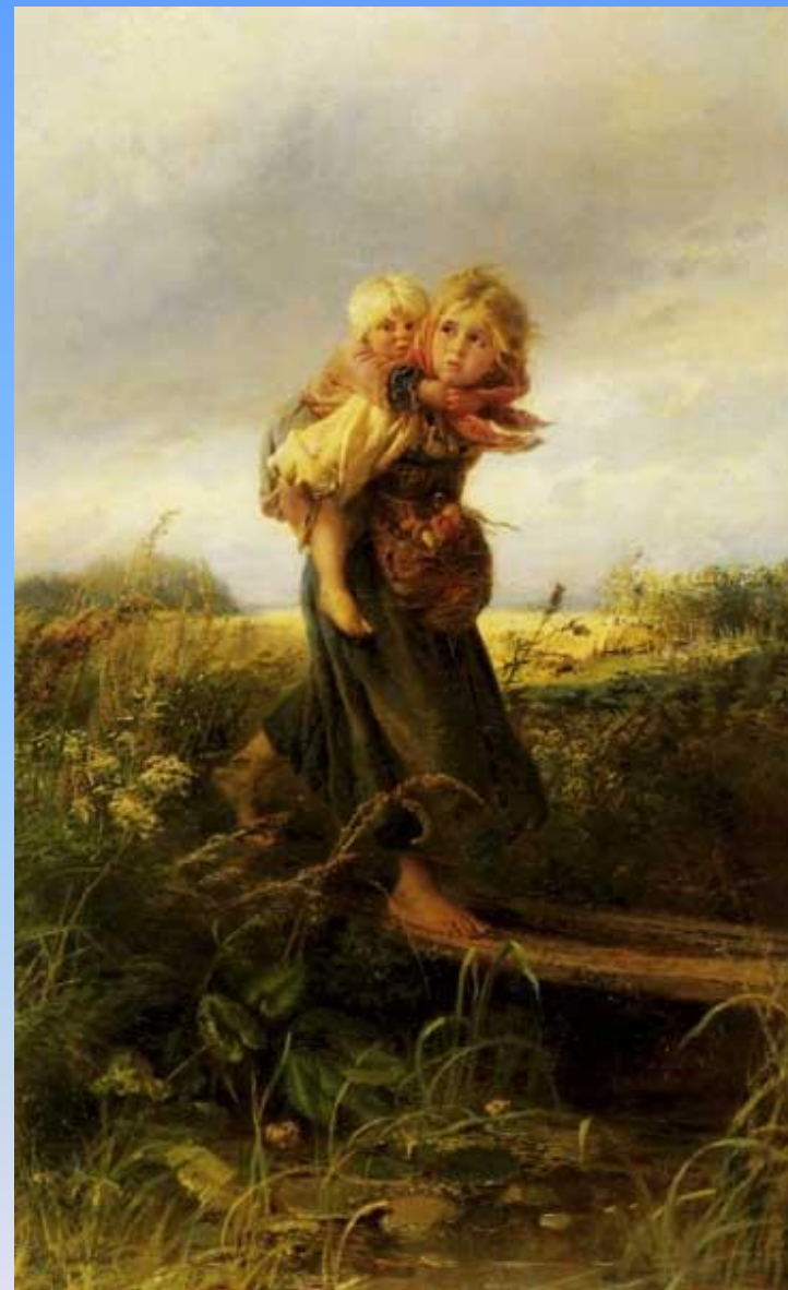
Маковский Константин Егорович «Дети, бегущие от грозы».