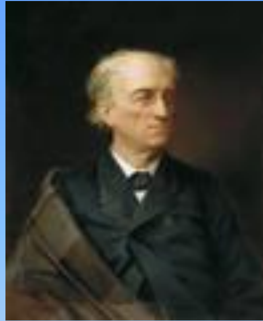
Фёдор Иванович Тютчев