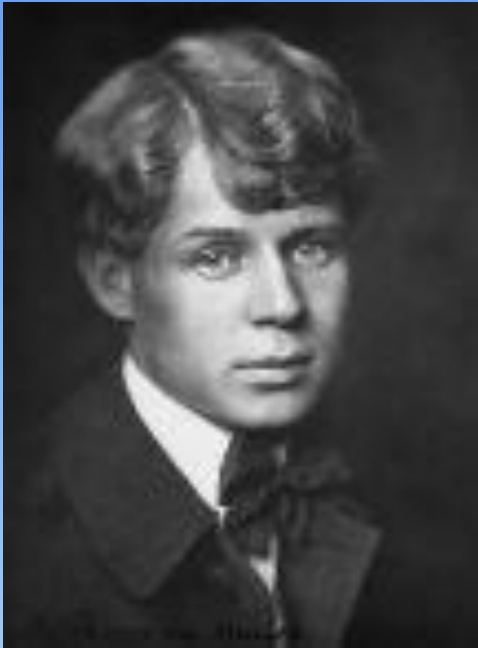
Сергей Александрович Есенин.