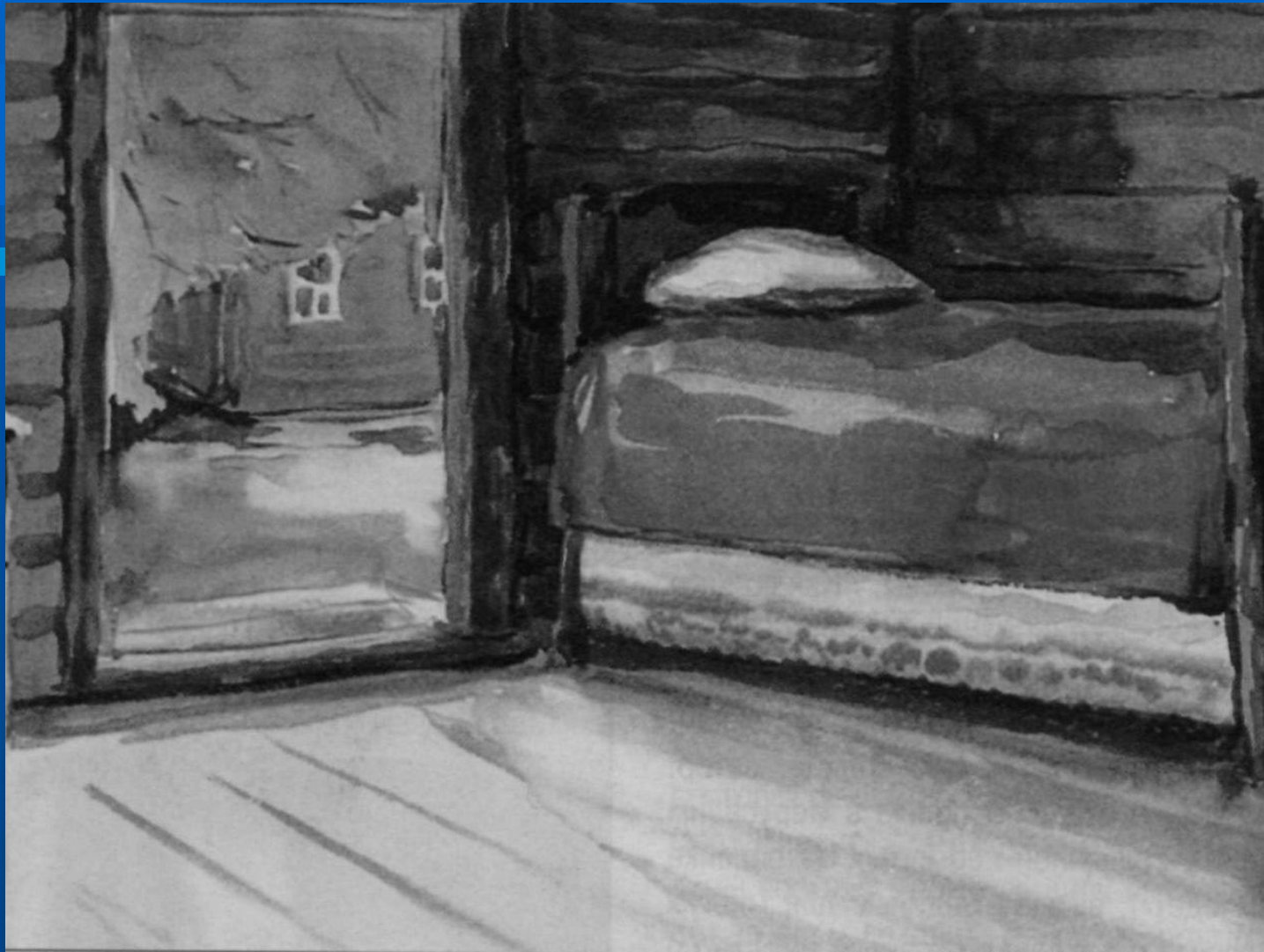
Любимый кабинет С.Есенина (амбар)