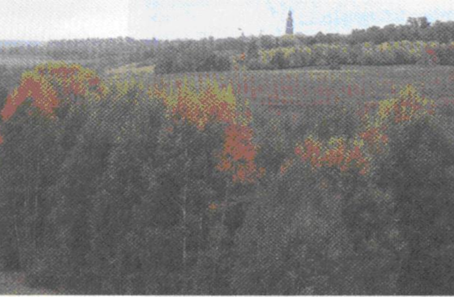
Окрестности села Константиново