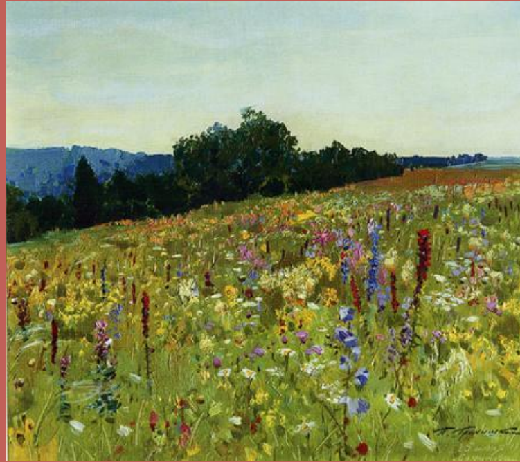
П.М. Гречишкин. Поляна Бучинка, 1959 г

Солончаки. Вихры полыни сивые да коршунов ленивые виражи... Скажи мне, степь, ну что в тебе красивого на чем тут глазу отдохнуть, скажи? Быть может, эти жилистые донники тебя преображают по весне, когда ветров серебряные дольники звучат на зеленеющей волне? Эх, степь родная, воля ястребиная, росы алмазный высверк под лучом. Но красота твоя неистребимая живет в душе, и весны ни при чем.