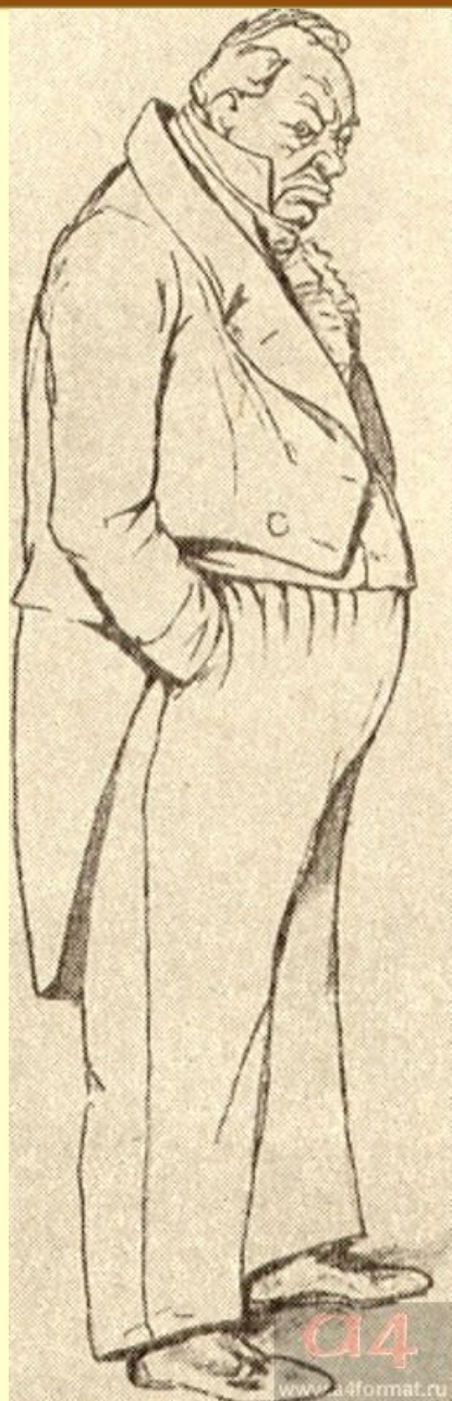
Аммос Фёдорович Ляпкин-Тяпкин (судья). Художник П.Боклевский