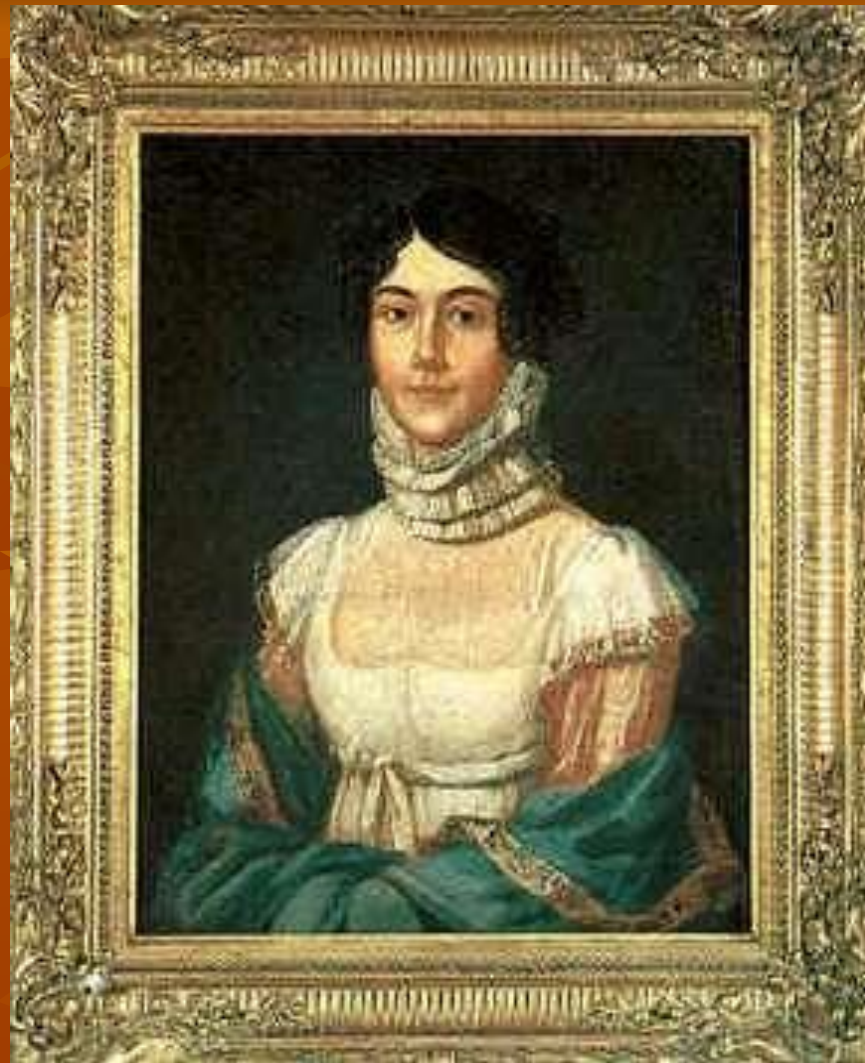
Ю.П.Лермонтов. М.М.Арсеньева (Лермонтова).