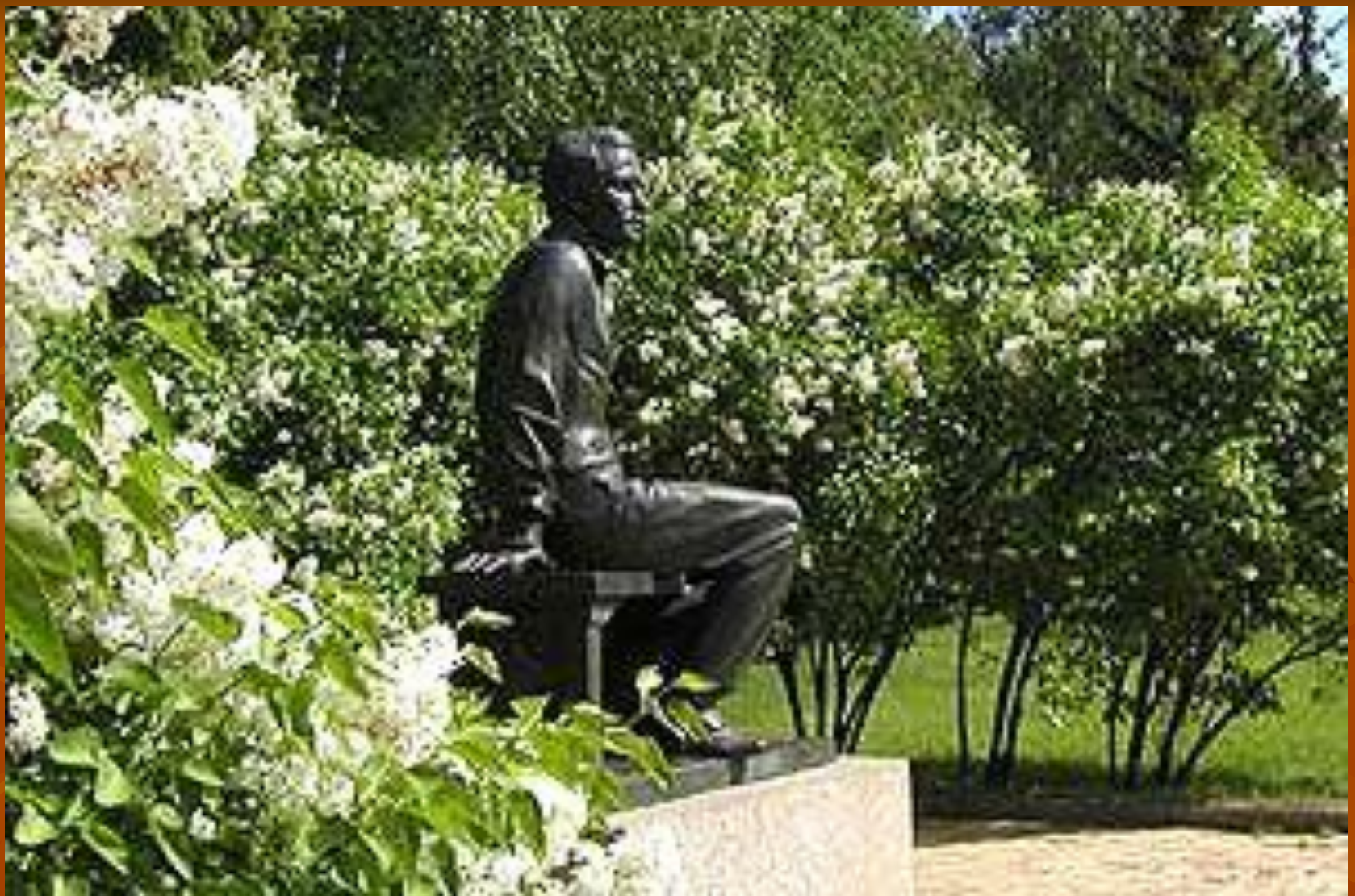
Памятник М.Ю.Лермонтову в Тарханах.