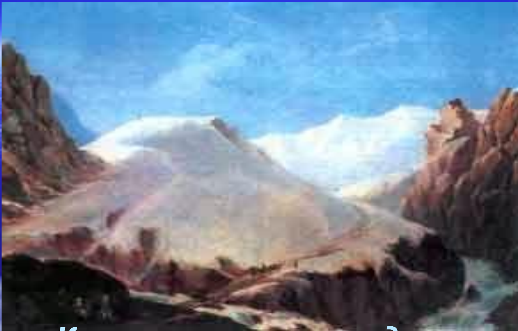
«Крестовая гора» - одна из лучших работ М.Ю. Лермонтова. 1837 год.