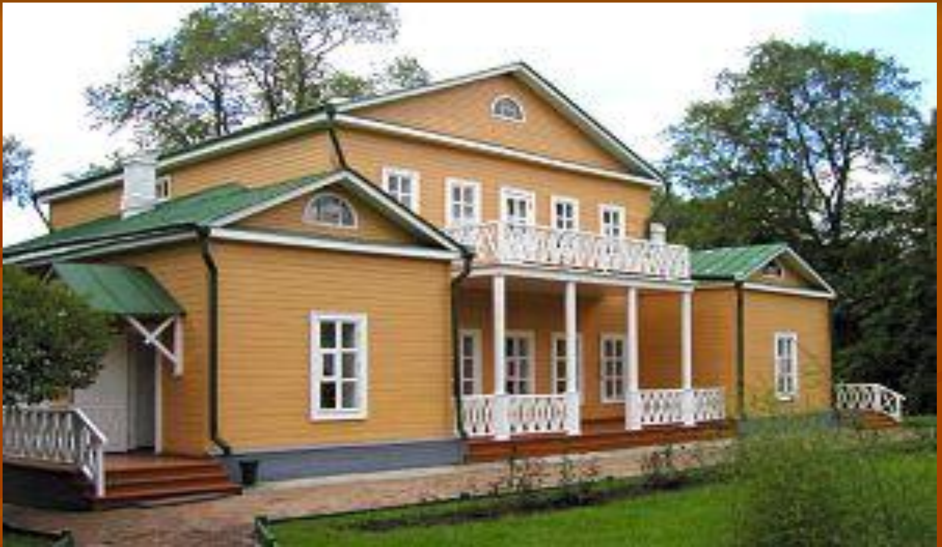
Дом-музей М.Ю.Лермонтова в Тарханах.