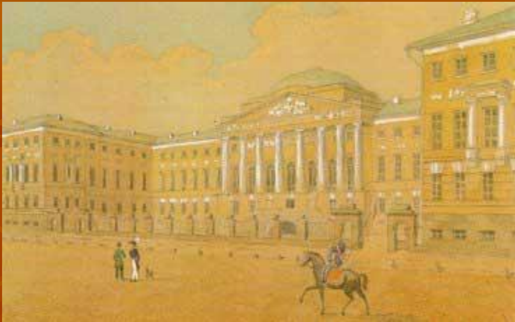
Москва. Благородный пансион при Московском университете.