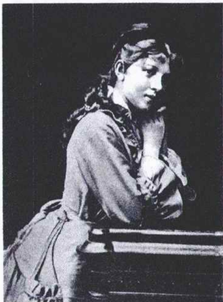
А.А. БЛОК (мать поэта).