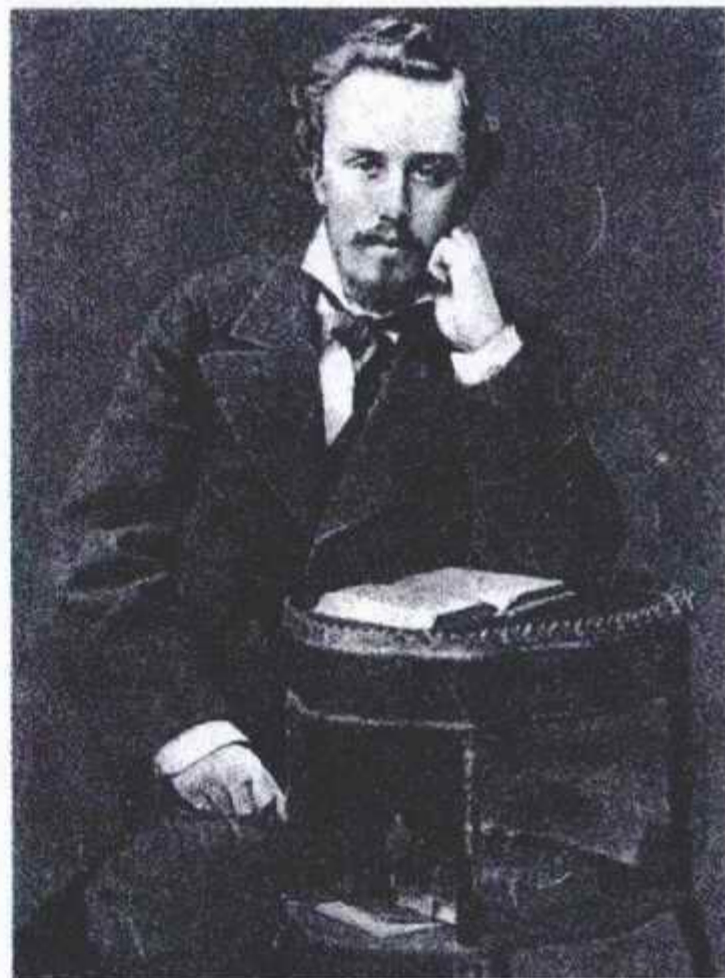
А.Л. БЛОК (отец поэта).